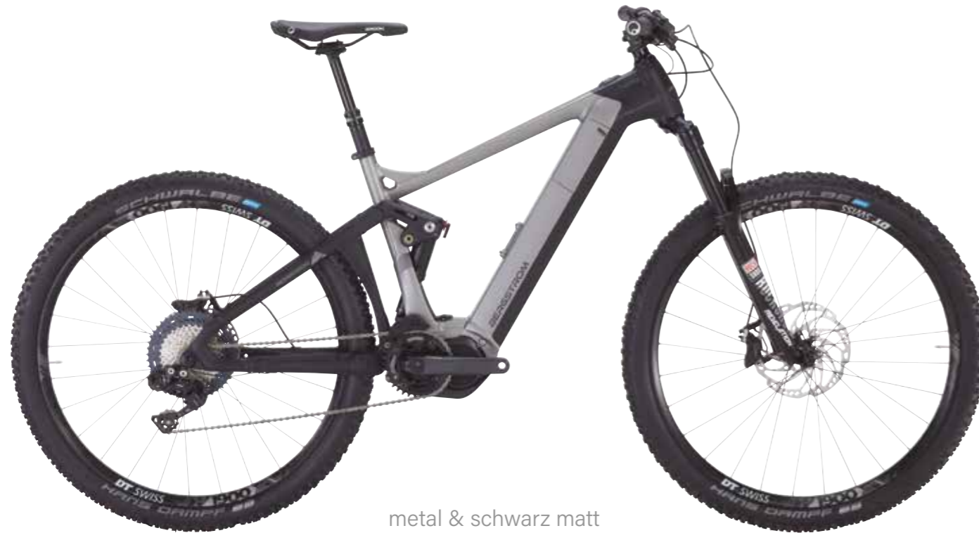
metal & schwarz matt