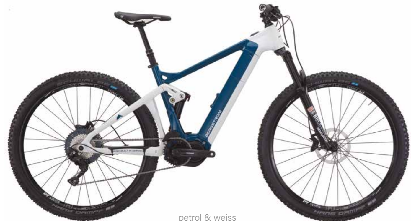
petrol & weiss