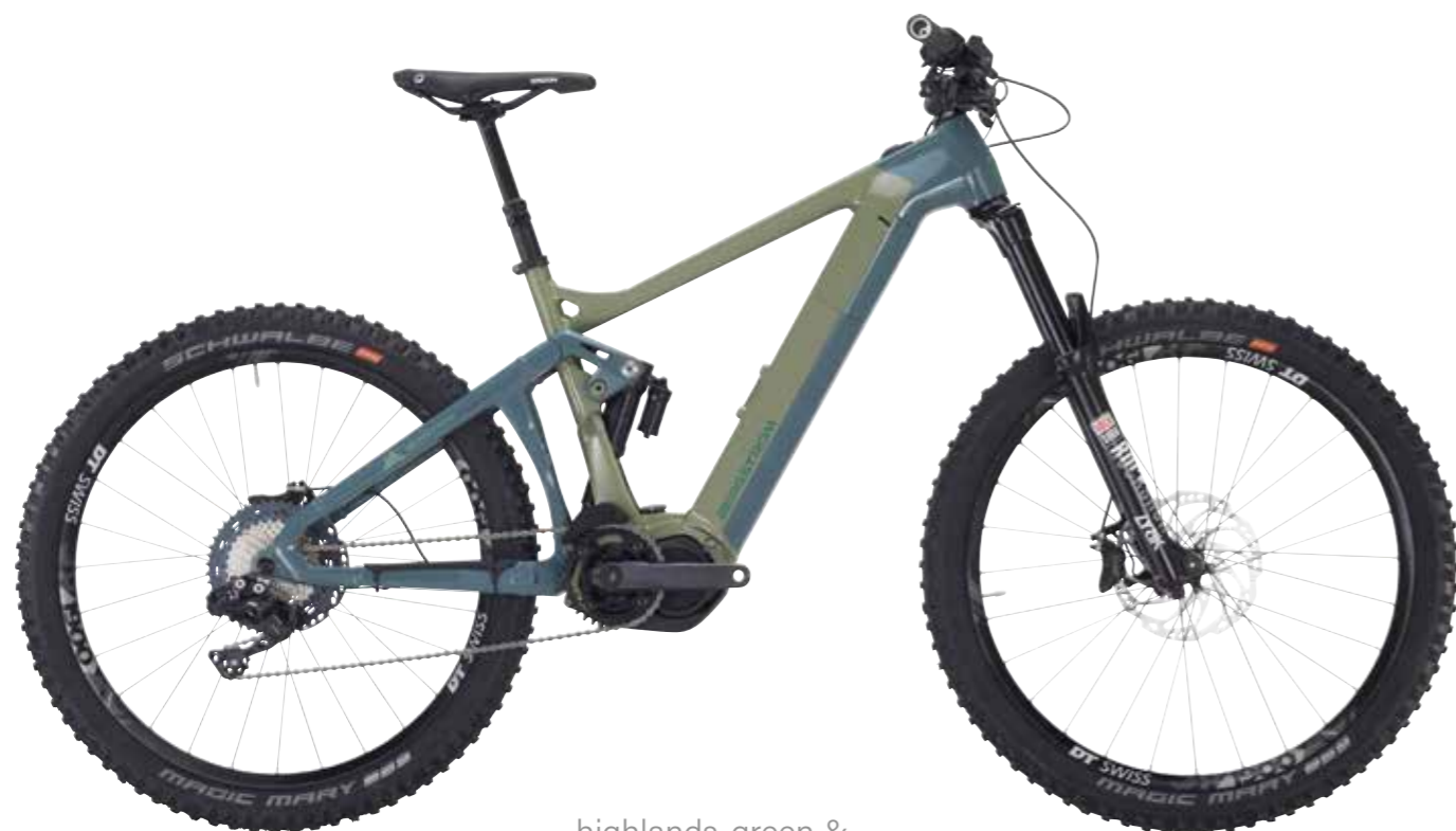
highlands-green & eisengrau