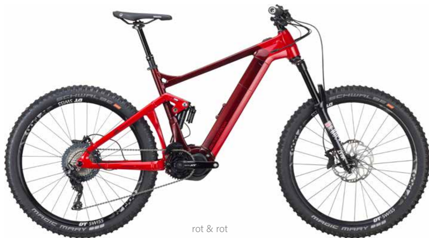
rot & rot