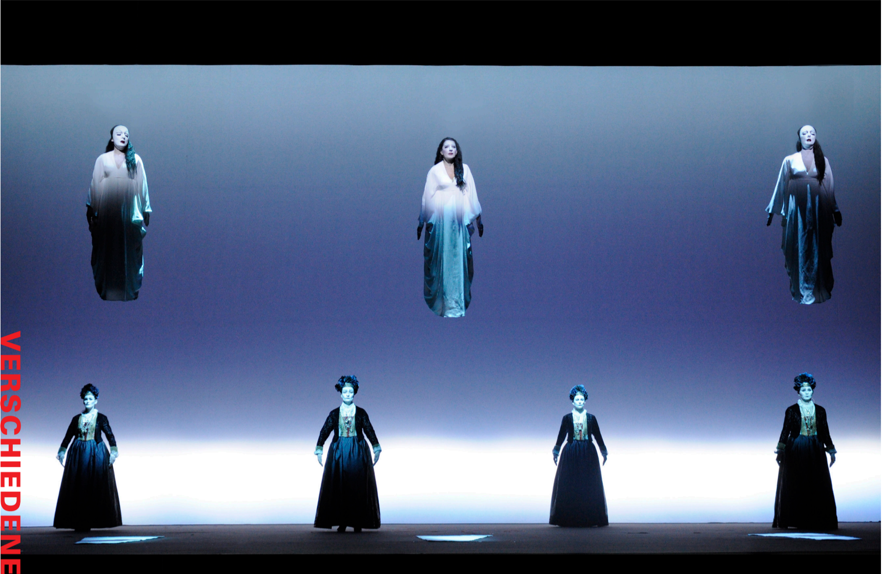
BILD OMID HASHEMI (WWW.OMIDHASHEMI.ART) COURTESY OF THE MARINA ABRAMOVIC ARCHIVES