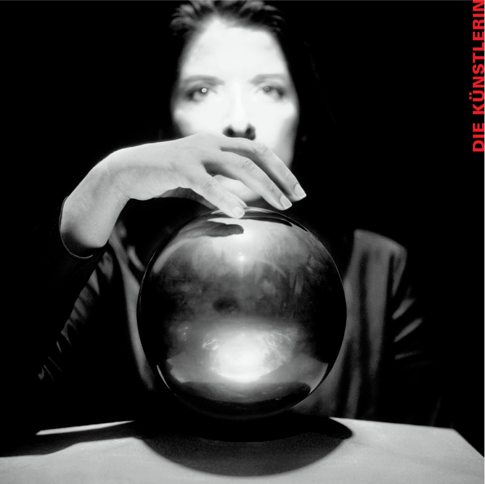
«Tesla Urn».Chromogenic print. 2003.