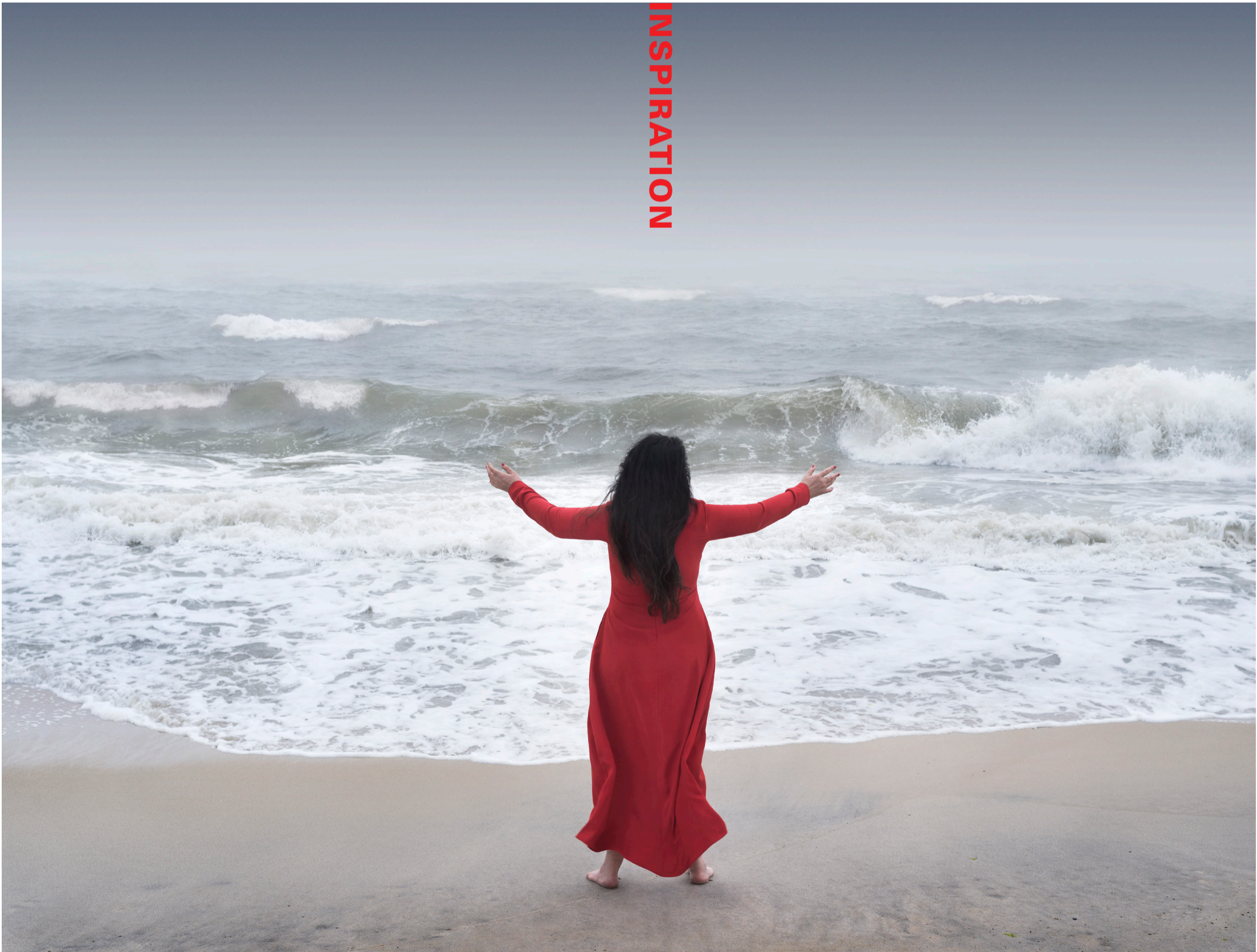
Performance for the Seas. Performance for photo. 2024.