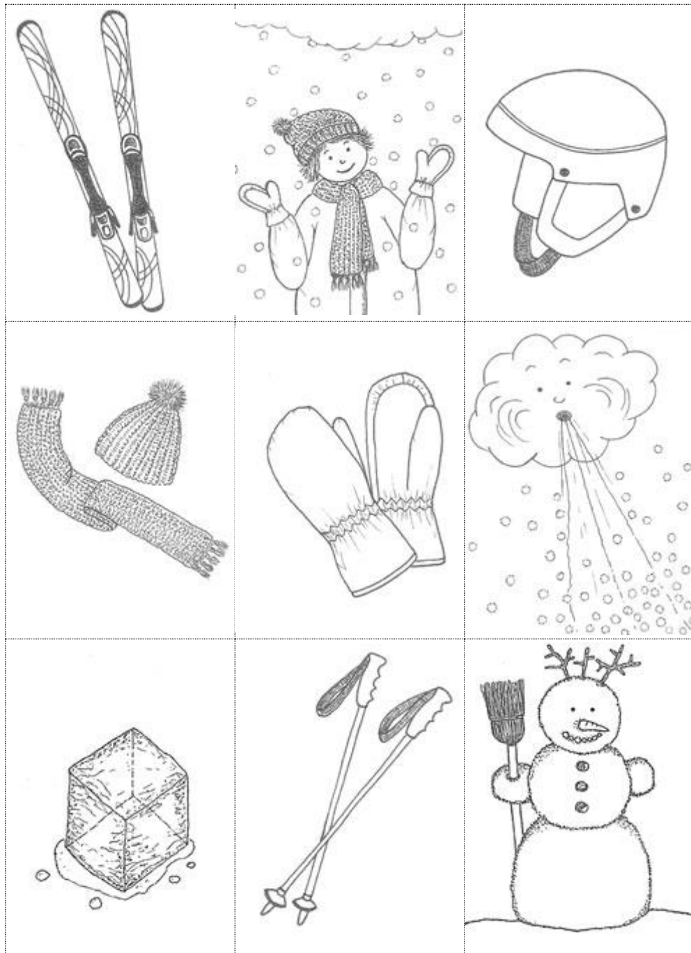
Illustrazioni: Franziska Wirz