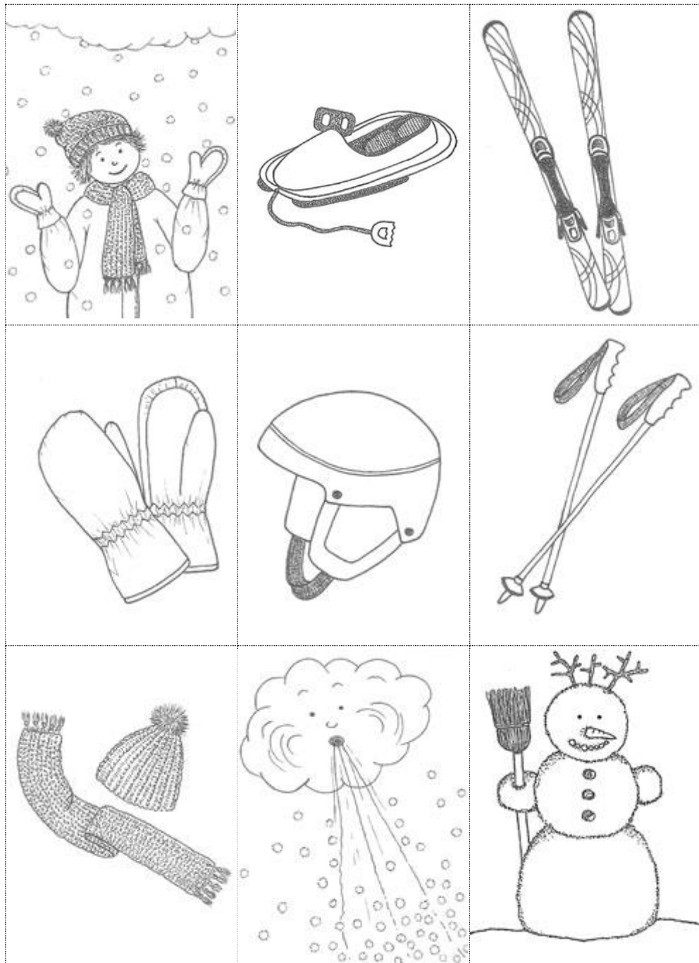
Illustrations: Franziska Wirz

Dessins (de gauche à droite et de haut en bas) Neige, bob, skis, Gants, casque, bâtons, Bonnet/écharpe, tempête/vent, bonhomme de neige.