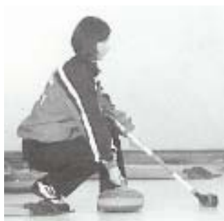
Position de base

Faire attention à ce que le balai soit tenu correctement et que le pied du sliding soit à plat sur la glace dès le début.