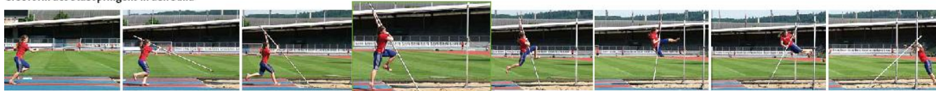
Grobform des Stabspringens in den Sand