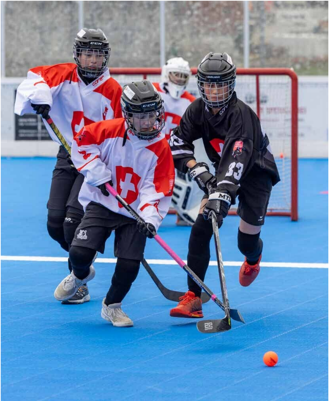
Provisorisches Bild, Original benötigt (Breitformat)

Halte dir stets vor Augen, wie wichtig Wiederholungen für den Entwicklungs- und Lernprozess sind. Variiere die Übungen laufend und Sorge so für Abwechslung. Achte gleichzeitig darauf, dass der Kern einer Übung erhalten bleibt. Das wiederholte Üben verdeutlicht den Kindern und Jugendlichen ihren Fortschritt und stärkt so ihr Selbstvertrauen und ihre Motivation.