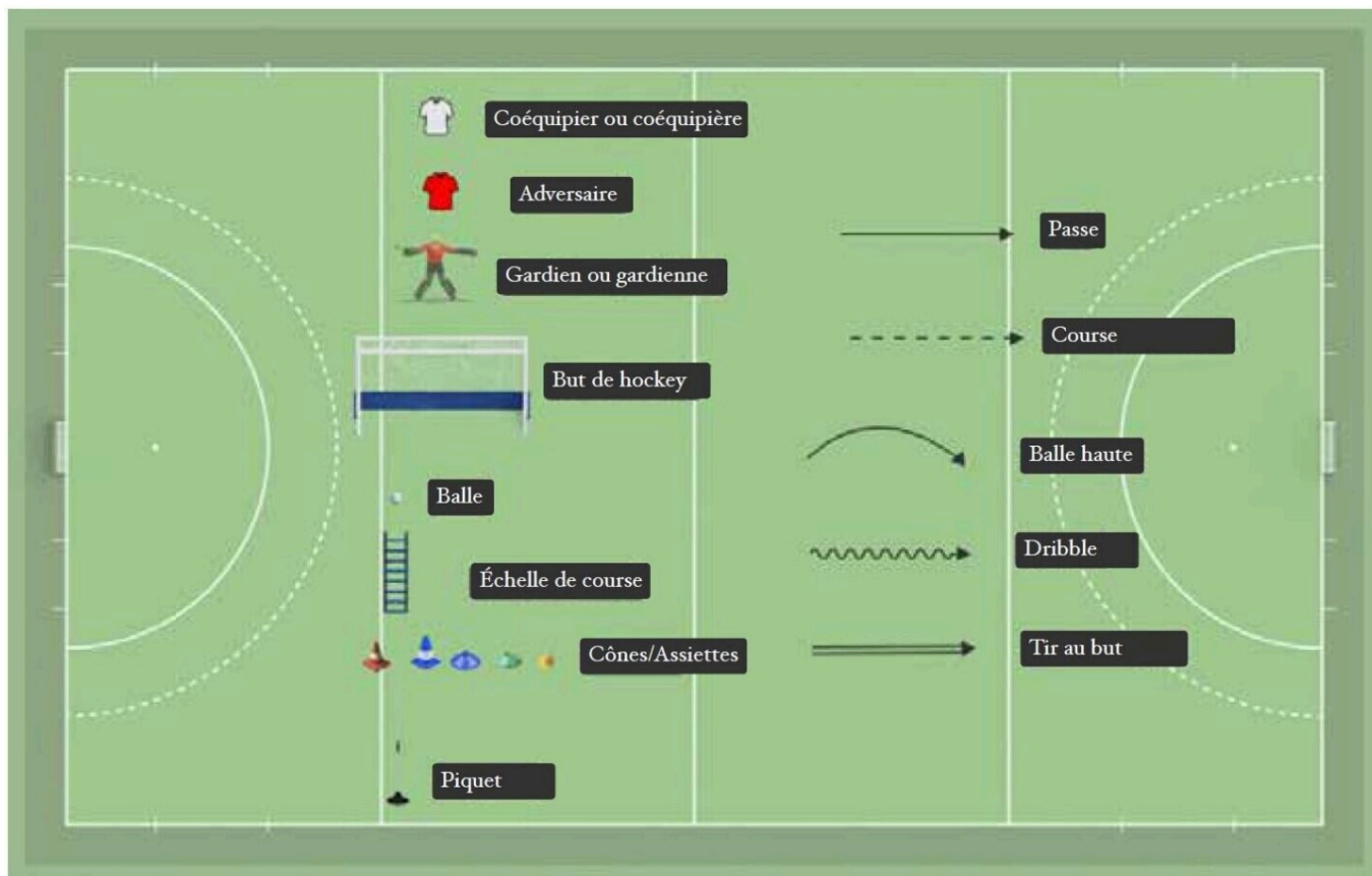
La langue du hockey sur gazon

Une fois la balle récupérée, les joueurs lancent immédiatement la contre-attaque. La porteuse ou le porteur de la balle s’élance rapidement en direction du but adverse en dribblant ou en faisant une passe vers l’avant. Si la contre-attaque ne fonctionne pas, les attaquants veillent à garder la balle dans leurs rangs.