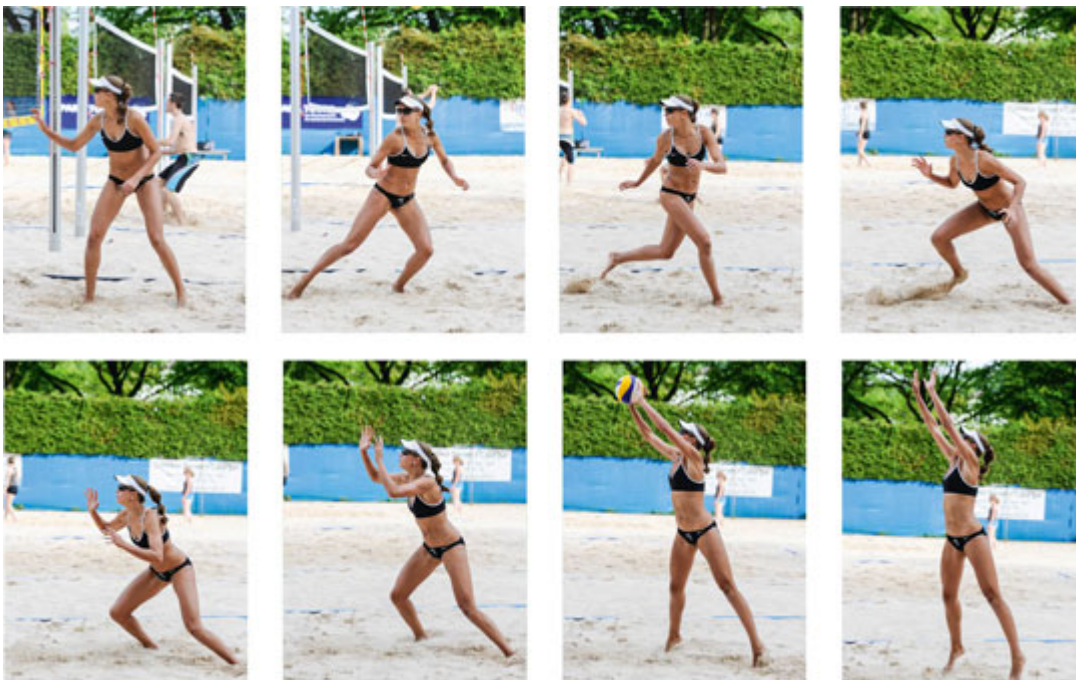
Sequenza di immagini: spostamento per difendere