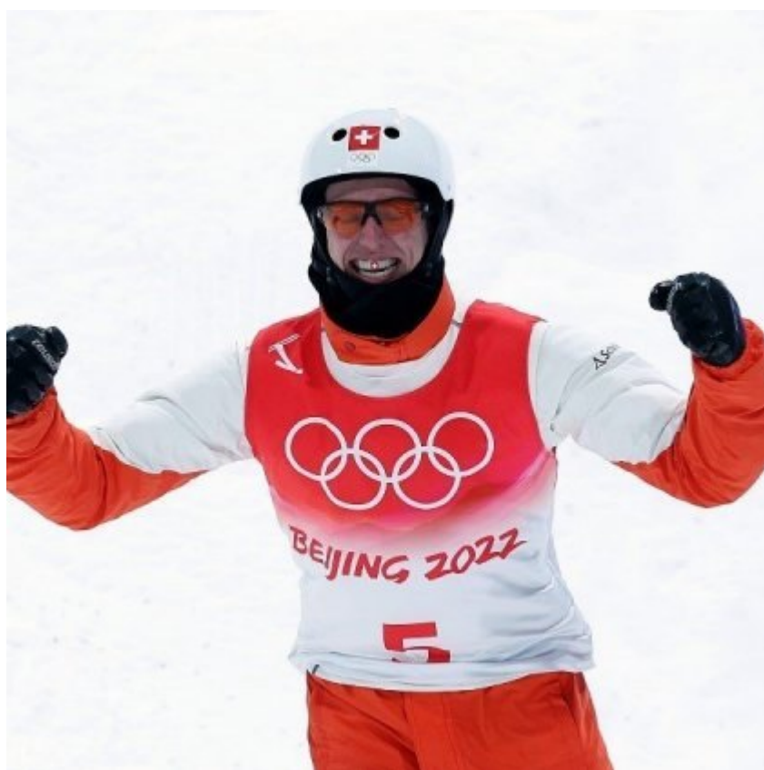
Pirmin Werner, Freestyle Skiing Aerials, 4° posto alle Olimpiadi di Pechino 2022

«Adoro catapultarmi in aria con gli sci. Girare sul mio asse, fare salti e figure acrobatiche. Roteare in aria, volare, l'adrenalina che invade tutto il mio corpo... è semplicemente indescrivibile».. Così Pirmin Werner spiega la sua passione per gli aerials.