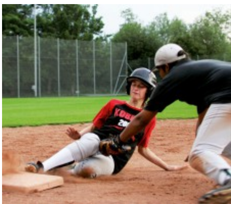
I ruoli di difensori e di attaccanti sono predefiniti nel baseball.

Il baseball approdò sulle rive opposte dell'Oceano Atlantico oltre 25 anni or sono. In Svizzera, la federazione di baseball fu fondata nel 1981. Nelle scuole, invece, questo gioco impegnativo basato su lanci e prese non figura nel repertorio della lezione di educazione fisica. Un vero peccato visto che gli accessori principali richiesti – una mazza ed un guantone – piacciono molto ai giovani e rendono il gioco più avvincente rispetto alla versione più soft, la palla bruciata.