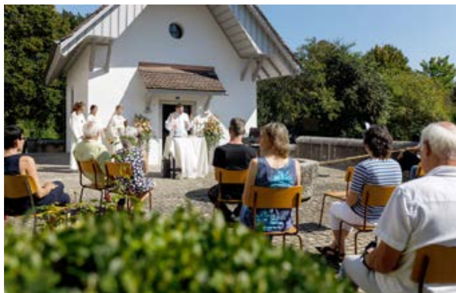
L'inaugurazione della Cappella di Sant'Antonio, restaurata nel 2020 con l'aiuto della MI.

In seguito, tra i parroci del XIX secolo si distinse Friedrich Georg Schwendimann (1867–1947), un ecclesiastico che svolse ruoli importanti per la città di Soletta e la diocesi di Basilea. Dopo essere stato parroco a Deitingen dal 1892 al 1906, il sacerdote fu nominato parroco di Soletta e prevosto della sua cattedrale. A lui si riconosce il merito di aver salvato e conservato il Duomo di Sant'Orso.