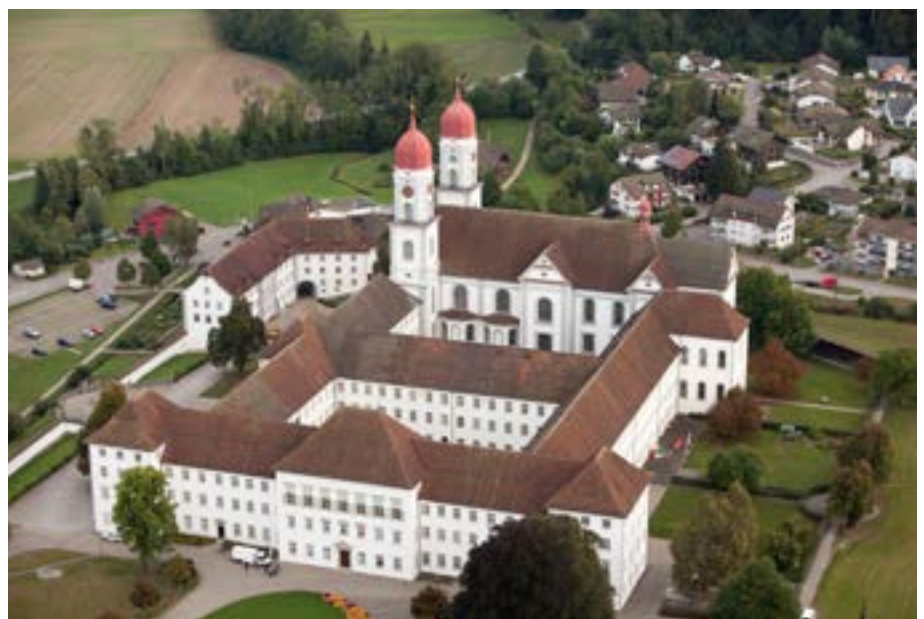
Il monumentale complesso monastico barocco di Sant'Urbano.

Sul retro del complesso, nel 1528, fu edificata una cappella privata. L'abate Malachias la ampliò nel 1713 in stile barocco e la aprì sulla Hintere Gasse, così chiamata ancora oggi nel linguaggio popolare. Solo a partire dal 1893 questa via fu denominata ufficialmente St.-Urban-Gasse, in riferimento al patrono del monastero. Papa Urbano I, martirizzato nel 230, è il patrono dei viticoltori e dei vigneti e viene raffigurato con la tiara, i calici e la vite. Il suo omonimo Urbano V (1362–1370), invece, fu beatificato nel 1870 ed è ricordato come un Papa che si dedicò alla Riforma della Chiesa medievale. (ufw)