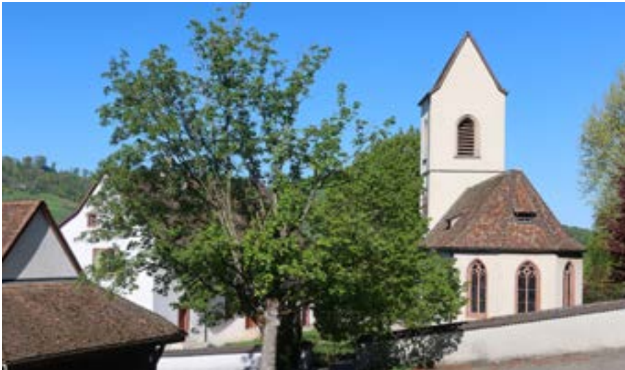
La chiesa di Läuelfingen.