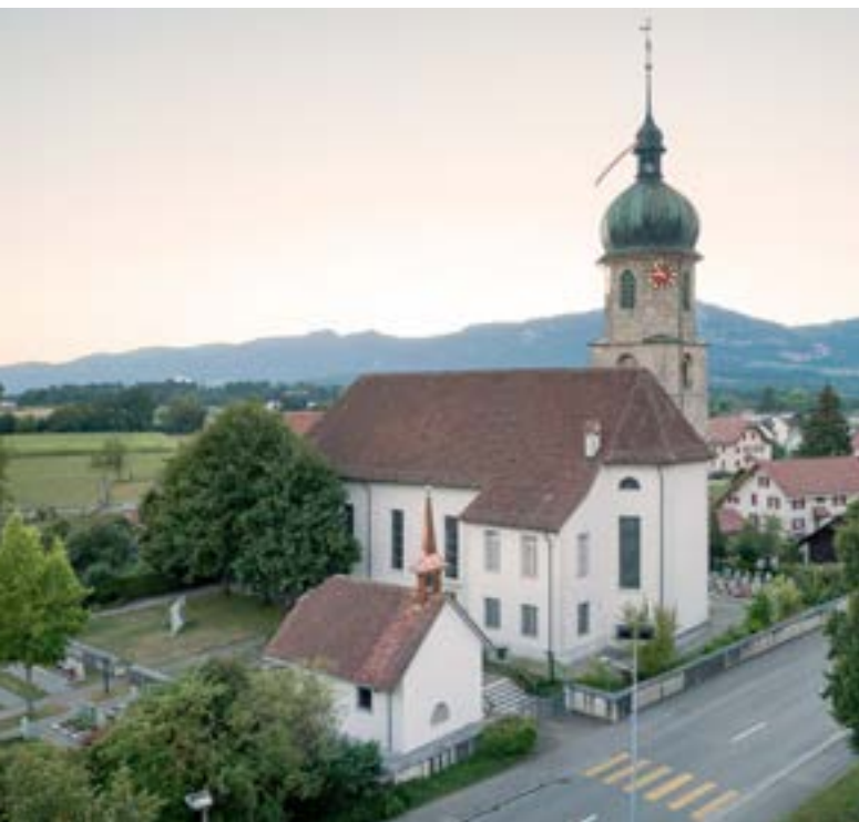
La chiesa parrocchiale e la cappella di Sant'Antonio viste da sud-est.