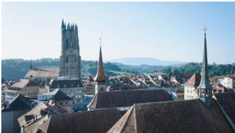
Vista sulla cattedrale dai tetti delle chiese francescana e di Notre-Dame.