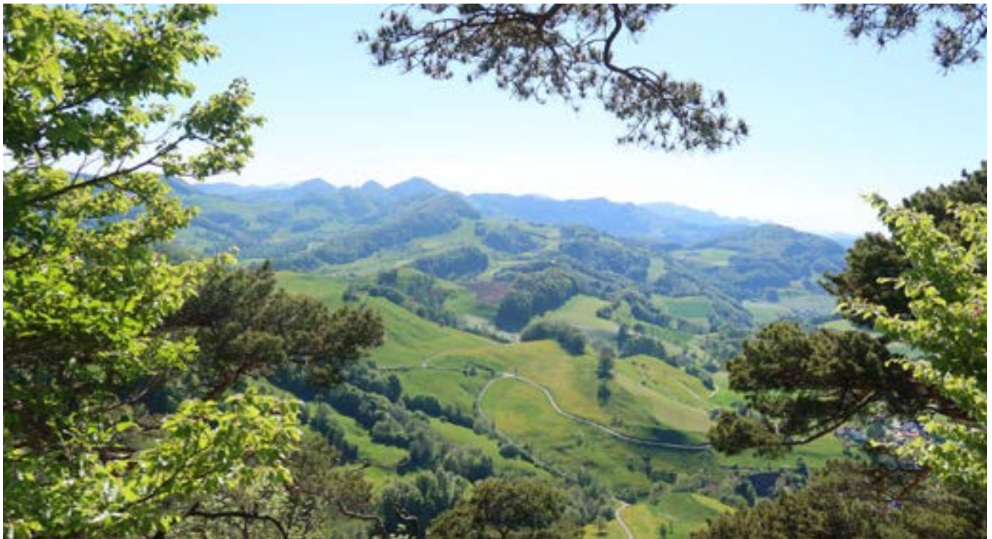
Vista dal Flueberg sul Giura basilese e solettese.