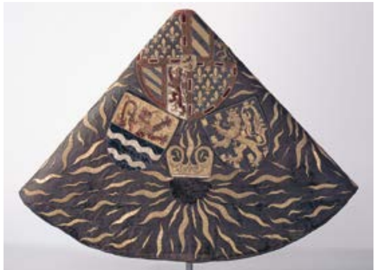
Piviale proveniente dal bottino borgognone.