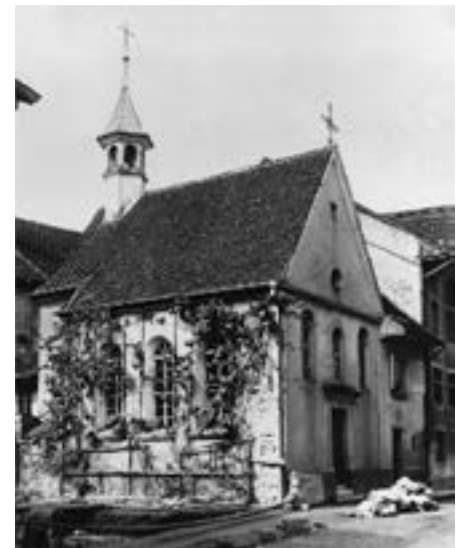
La cappella di Sant'Urbano a Soletta nel 1912.

della città, i rapporti tra il monastero e Soletta modellano fino ad oggi l'assetto urbano della città. Nel 1252, il monastero di Sant'Urbano acquistò l'odierna casa Stalden 11 e, insieme a vari privilegi fiscali e giuridici, ottenne in tale occasione il diritto di cittadinanza di Soletta. La casa fungeva da edificio amministrativo per i beni situati lontano dal monastero, fungendo da rifugio per i viandanti e da alloggio per i monaci di Sant'Urbano. Nel 1520, poi, il monastero acquistò anche la casa al numero 30 della Gurzelngasse, che divenne così la St.-Urban-Hof. In tale occasione, i privilegi concessi al momento dell'acquisizione della casa Stalden 11 furono trasferiti alla nuova sede cittadina della comunità. Durante la Repubblica Elvetica, il complesso ristrutturato servì da sede ufficiale al governatore Xaver Zeltner. Infine, già nel 1836, quindi ancora prima