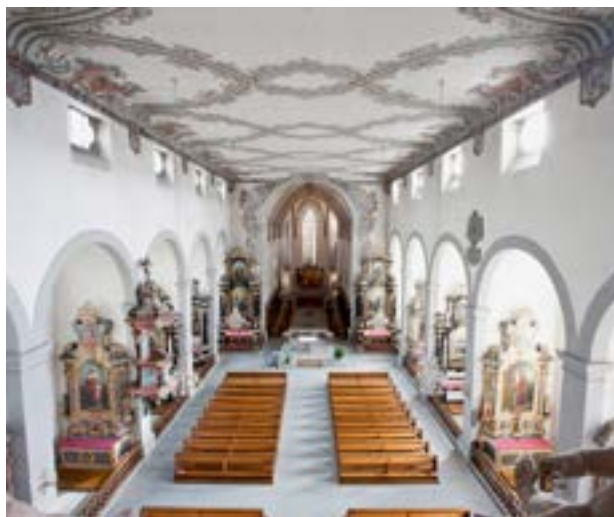
L'interno della chiesa dei Francescani di Friburgo.

Iscrizioni: fino al 5 agosto 2026 online sul nostro sito: www.im-mi.ch/kulturau-sflug2026 , tramite email: denise.stoeckli@im-mi.ch o telefono: 041 710 15 01.