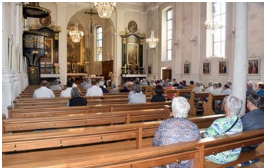
Uno sguardo all'interno della chiesa parrocchiale dell'Assunzione di Maria a Deitingen.

La Missione Interna sostiene con convinzione i lavori di ristrutturazione interna dell'imponente chiesa. La parrocchia di Deitingen forma una comunità vivace, alle cui attività contribuiscono il coro parrocchiale, un'associazione femminile, l'associazione giovanile Jubla e il Team 72, un'altra associazione per giovani adulti che porta avanti le tradizioni parrocchiali, nonché l'associazione di assistenza sociale e cooperazione allo sviluppo «Weltverein» e gli altri fedeli. La Missione Interna sostiene la ristrutturazione interna della chiesa con un prestito senza interessi e la campagna estiva 2026 di raccolta fondi, in cui ogni franco donato viene destinato direttamente a questo progetto senza alcuna detrazione.