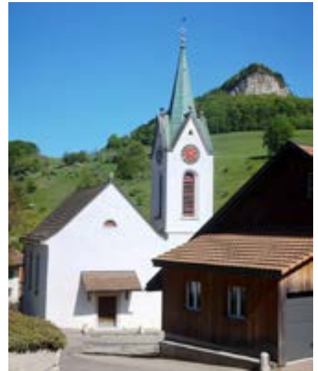
La chiesa di Wisen ai piedi del Flueberg.

Wisenberg. Il percorso si allunga un po', ma vale la pena gettare uno sguardo da questa altura sul bacino di Wisen e sulle cime del Giura. Sulla strada per Froburg attraversiamo una zona con doline. Si tratta di un interessante fenomeno geologico in cui l'erosione ha creato delle cavità circolari nel terreno calcareo. Il sentiero passa accanto a una grande antenna e conduce alla tenuta di Froburg con albero e ristorante. Intorno al 1879, il filosofo tedesco Friedrich Nietzsche soggiornò più volte in questo luogo di cui apprezzava il clima. Non lontano da qui si trovano le rovine dell'omonimo castello che dominava il versante sud della Untere-Hauenstein-Strasse.