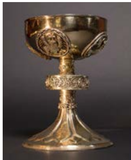
Il calice borgognone del tesoro della Collegiata di San Leodegario a Lucerna.

Ancora più esigua è la parte dei tesori di arte sacra del bottino di queste Guerre che è giunta fino a noi. A riguardo, non si può che interrogarsi sulle ragioni per cui proprio gli oggetti sacri più significativi e interessanti per la storia religiosa e della devozione siano andati perduti. In tal senso, non si può non ricordare particolarmente quello che era probabilmente il pezzo più prezioso del bottino, cioè un altare portatile denominato «mensa d'oro». Riccamente decorato con pietre preziose, in esso erano state incastonate «le reliquie più preziose che si possano trovare», ovvero reliquie legate alla Passione di Gesù. Oltre a queste, sono andate perdute anche le numerose altre reliquie, sebbene fossero state catalogate con grande dovizia