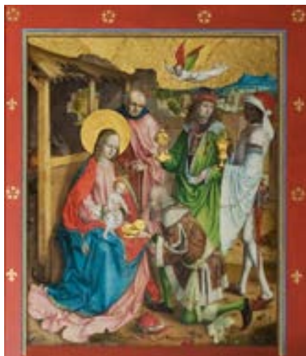
Altare del Maestro dei Garofani nella chiesa francescana.

Friburgo in Nuithonia è una città bilingue situata nell'omonimo cantone e vanta uno dei centri storici medievali meglio conservati della Svizzera. Il centro storico occupa una posizione pittoresca su un promontorio roccioso a picco sulla Sarine e unisce le tradizioni culturali tedesche e francesi. Il convento dei frati minori francescani (in abito nero) fu fondato nel 1256. La chiesa del convento è uno degli edifici religiosi più importanti della città e ospita preziosi altari. La navata attuale risale al XVIII secolo. Il municipio di Friburgo fu costruito tra il 1501 e il 1522 sul sito dell'antico castello degli Zähringen. È un importante simbolo della città e sede delle autorità cantonali. La collegiata gotica di San Nicola fu costruita tra il 1283 e il 1490 ed elevata al rango di collegiata nel 1512,