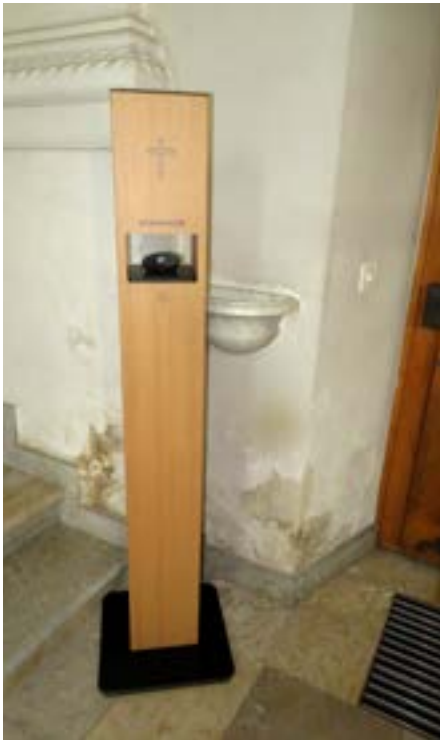
Danni evidenti all'interno della chiesa.