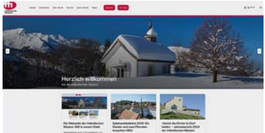
Il sito web rinnovato della Missione interna consente agli utenti un accesso semplificato all'offerta di servizi MI e ai documenti per le richieste di sostegno finanziario.

Inoltre, grazie alla sezione servizi del sito, notevolmente ampliata, è possibile comunicare anche i cambiamenti di indirizzo. Inoltre, viene dato ampio spazio al concetto di sostenibilità: nella rubrica «Mercatino», le parrocchie e le comunità religiose possono