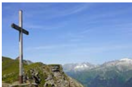
Una croce nelle montagne grigionesi.

È merito dello storico Peter Hersche, specializzato in storia sociale e culturale ed