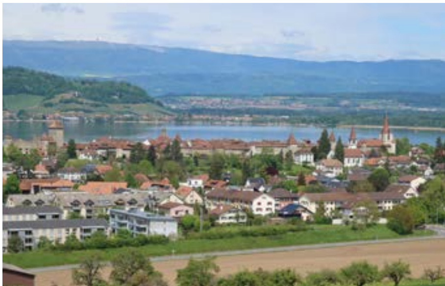
La città di Morat vista dal Bois Domingue, dove si trovava il quartier generale di Carlo il Temerario.

Questo però non è l'unico cimitero della battaglia. A Salvagny (Salvenach), l'antico luogo di Beinäcker (letteralmente campo delle ossa) oggi Grossacher; il nome rinvia senza dubbi al tragico esito della battaglia per tanti dei soldati che vi presero parte. I resti furono riesumati e sepolti in un ossario vicino o direttamente accanto alla cappella di Meyriez, la quale a sua volta subì diverse ristrutturazioni. All'inizio del XVI secolo, Berna e Friburgo vi volevano persino insediare una piccola comunità francescana, ma, invece, con l'arrivo della Riforma protestante anche la cappella scomparve. L'ossario, invece, continuò ad esistere, attirando curiosi e antichi visitatori, che, a quanto pare, non esitavano a portare via le ossa come souvenir. La sua distruzione durante l'invasione francese del 1798 può essere ricondotta alla rabbia