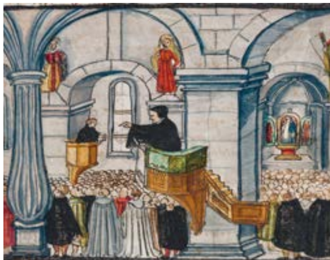
La disputa del 1526 tra Giovanni Eck e Giovanni Ecolampadio.

La Disputa di Baden si svolse nel maggio e giugno del 1526 nella chiesa cittadina di Baden. Vi parteciparono rappresentanti dei 13 Cantoni della Confederazione e teologi provenienti dalla Svizzera e dall'estero. Durante questo dibattito furono discussi i fondamenti sia dell'antica fede (cattolica) che di quella nuova (riformata). La Disputa di Baden ebbe una funzione di cerniera tra gli inizi della Riforma (1523 a Zurigo) e la «soluzione» nelle guerre di Kappel (1529/1531). La pace che ne seguì fu fragile e spesso minacciata, ma la Confederazione non si disgregò. La «Disput(N)ation» 2026 è un progetto ecumenico congiunto della Chiesa riformata di Baden plus e del Comune ecclesiastico cattolico romano di Baden-Ennetbaden. Il progetto di dialogo e pace, che avrà risonanza in tutta la Svizzera, con l'incontro dei giovani animato dalla Comunità di Taizé, è sostenuto dalla Missione Interna.