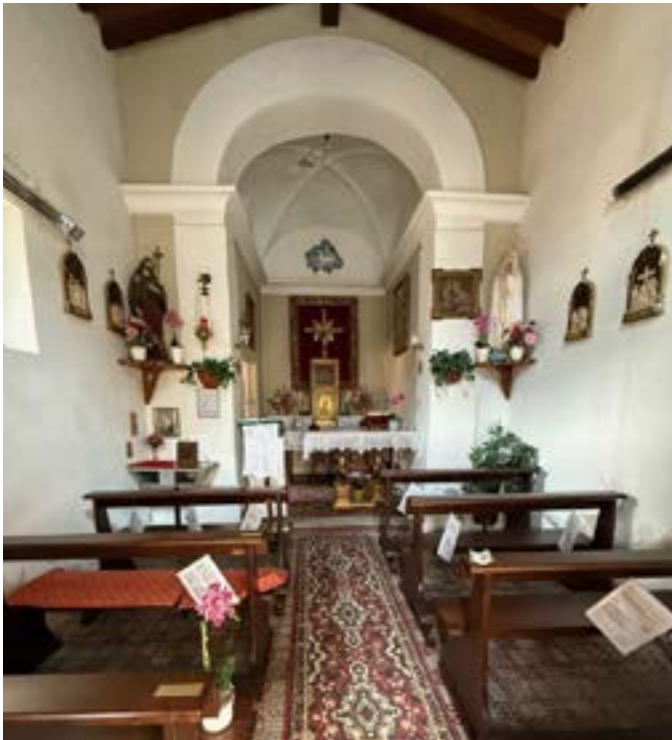
L'interno della chiesa con i banchi donati da un'associazione locale.