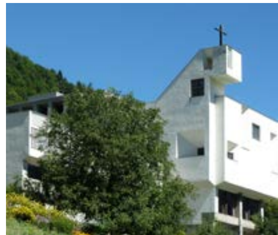
Il convento a inizio dell'estate.

Questo articolo è pubblicato contemporaneamente sul bollettino parrocchiale dei Grigioni. La MI ringrazia per il permesso di riproduzione.