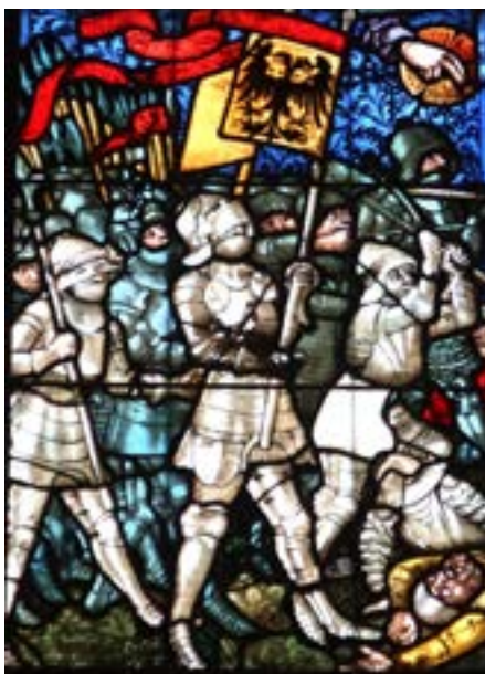
Collegiata di Berna, vetrata dal ciclo dedicato ai Diecimila Martiri. Questa vetrata, che raffigura i futuri martiri, offre uno spaccato di una campagna militare del XV secolo.