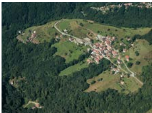
Veduta sulla piccola località di Certara con l'Oratorio al centro e la lontana chiesa parrocchiale con il cimitero fuori dal paese in alto a sinistra, ai margini del bosco.

Sebbene illegale, nei secoli XIX e XX, il contrabbando ha svolto un ruolo importante lungo tutto il confine italiano del Canton Ticino. I dazi doganali svizzeri erano più bassi, il che rendeva il tabacco, lo zucchero e il caffè merci di contrabbando molto ambite. Tra il 1868 e il 1894, gran parte del tabacco prodotto in Ticino veniva trasportato illegalmente oltre confine. Durante la Seconda guerra mondiale, il contrabbando di generi alimentari al confine meridionale raggiunse il suo apice. Il Museo doganale svizzero a Cantine di Gandria ricorda questo fenomeno socio-economico.