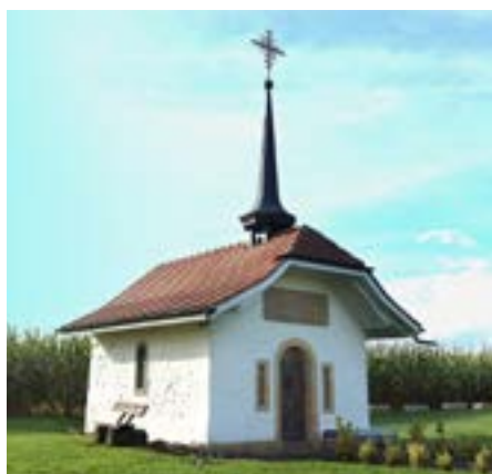
Die Urbanskapelle in der Nähe von Cressier.

Die Stadt Freiburg hingegen hat bis heute einen Gedenkgottesdienst beibehalten. Früher wurden sogar zwei Jahrestage gefeiert, möglicherweise bis ins 19. Jahrhundert hinein: der Sieg von Grandson am 2. März und der Sieg von Murten am 22. Juni. Danach wurde nur noch der Jahrestag von Murten begangen. Lange Zeit wurde er auf einen Sonntag in der Nähe des 22. Juni festgelegt und war ein sehr feierliches Ereignis. So berichtete die Zeitung «La Liberté» 1952, dass die Kathedrale mit den Farben der Eidgenossenschaft, Freiburgs und Murtens sowie mit den Flaggen aller Kantone geschmückt war. Der Staat hatte den Altar «Unserer Lieben Frau vom Sieg» schmücken lassen, und die Behörden des Kantons und der Stadt Freiburg waren vollzählig zur Messe und zum «Te Deum» anwesend, ebenso eine Delegation aus Murten. Auch heute noch wird das Fest feierlich begangen,