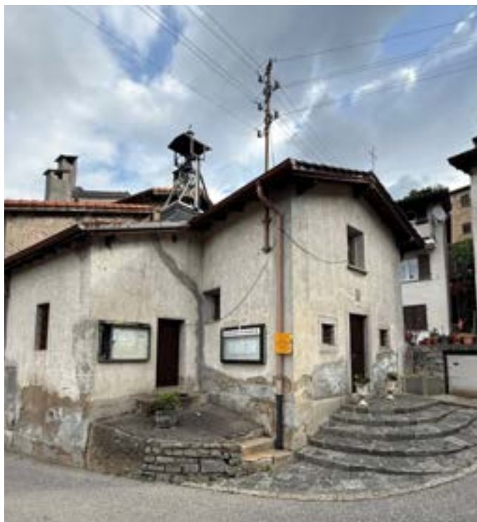
Blick auf das Oratorio San Rocco im Zentrum von Certara.