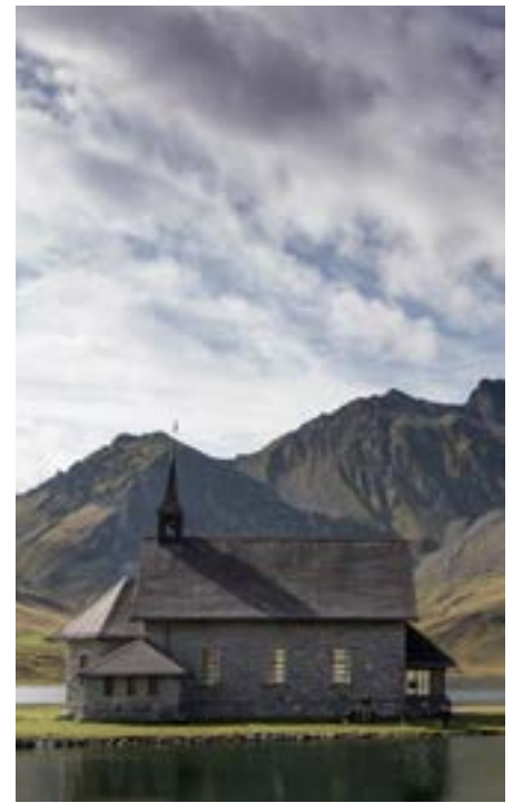
Die Marienkapelle auf der Melchsee-Frutt.

Der 2024 erschienene Sammelband «Grenzgänge. Religion und die Alpen» beschäftigt sich ebenfalls mit den erwähnten Themengebieten. Er bietet einen eher essayistischen inter- und transdisziplinären Zugang zur Frage, wie Religion im Alpenraum erlebt, erzählt, dargestellt und reflektiert wird. Ausgangspunkt des Buches ist die Idee, dass die Alpen als Grenzraum eine spezifische Spannung zwischen Kontrollierbarem und Unkontrollierbarem, Gefährlichem und Heiligem erzeugen – ein Spannungsfeld, in dem religiöse Sinngebungen besonders sichtbar werden. Anders als klassische religionshistorische Untersuchungen verzichtet der Band auf enge Periodisierung oder lineare Geschichte; vielmehr nähert er sich dem