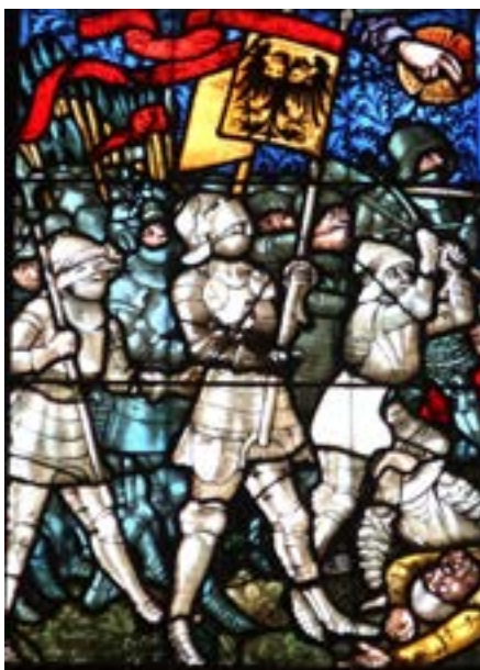
Berner Münster, Glasfenster aus dem Zyklus der Zehntausend Märtyrer. Dieses Glasfenster, das die zukünftigen Märtyrer darstellt, gibt einen Einblick in einen Feldzug im 15. Jahrhundert.