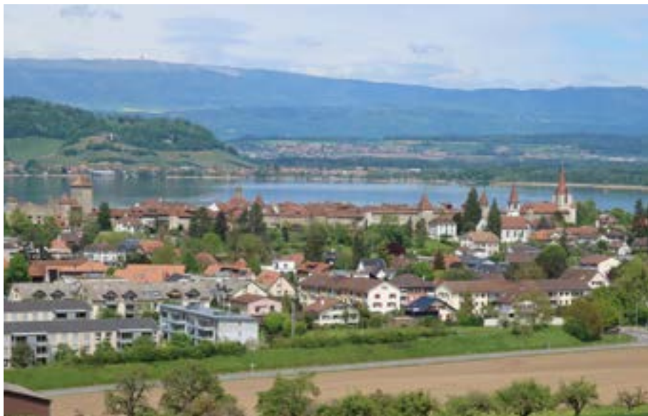
Die Stadt Murten vom Bodemünzi aus gesehen, wo das Hauptquartier von Karl dem Kühnen war.

Einige Jahre nach der Schlacht bei Murten, vermutlich 1481, errichtete der Vorsteher der Kapelle der heiligen Katharina in Murten eine Kapelle in der Nähe des Nachbardorfes Merlach (Meyriez). Der Grund dafür waren zwei Massengräber mit Leichen gefallener Soldaten, darunter vielleicht auch Schweizer, vor allem aber Burgunder, die mit zehn- bis zwölftausend Toten die überwiegende Mehrheit der Gefallenen von Murten stellten. Dies ist jedoch nicht der einzige Friedhof der Schlacht. In Salvenach (Salvagny) ist der ehemalige Ort Beinäcker (heute Grossacher) ein eindeutiger Ortsname. Die Überreste wurden exhumiert und in einem Beinhaus in der Nähe oder direkt neben der Kapelle beigesetzt, die mehrere Umbauten erfuhr. Zu Beginn des 16. Jahrhunderts wollten Bern und Freiburg dort sogar eine kleine Franziskanergemeinschaft ansiedeln. Mit der Reformation verschwand die Kapelle jedoch. Das Beinhaus blieb hingegen bestehen und zog Neugierige und die ersten Touristen an, die sich angeblich nicht scheuten, Knochen als Andenken mitzunehmen. Seine Zerstörung während der französischen Invasion von 1798 lässt sich durch den Zorn der burgundischen Soldaten erklären, die über die Nieder-