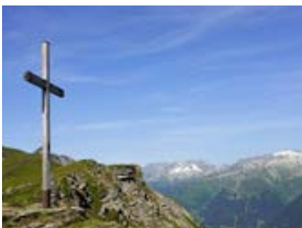
Wegkreuz im Bündnerland.

Peter Hersches Interpretation des Katholizismus in Berggebieten gewinnt an Schärfe im Zusammenhang mit der agrarischen Produktionsweise. Die barocke Betonung von Musse, Fest und Verschwendung stand in engem Bezug zu einer auf Existenzsicherung ausgerichteten Landwirtschaft mit begrenzten Rationalisierungsmöglichkeiten. Dadurch konnten sich kapitalistische Marktlogiken weniger stark durchsetzen als in reformiert geprägten Städten. Religiöse Feiertage legitierten Musse und schufen Freiräume, die in protestantischen Regionen seltener waren. Die konfessionellen Unterschiede wirkten sich nicht nur religiös, sondern auch gesellschaftlich, wirtschaftlich und kulturell aus. Trotz dieser Differenzen pflegten Katholiken und Reformierte einen Umgang, der von pragmatischer Toleranz geprägt war.