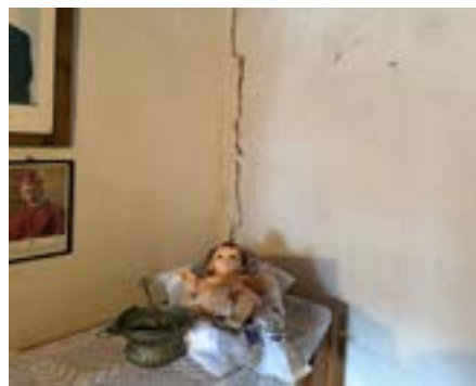
Unübersehbare Schäden in der Kirche und Sakristei.

Das Oratorio in Certara ist dem heiligen Rochus geweiht. Der heilige Rochus lebte im 14. Jahrhundert und war ein Rompilger, der sich der Pflege von Pestkranken widmete. Er gilt als Schutzheiliger gegen Seuchen und wird oft mit einer Pestbeule und einem Hund dargestellt. Sein Fest wird am 16. August gefeiert. Er ist im Tessin ein beliebter Heiliger, dem mehrere Pfarrkirchen geweiht sind.