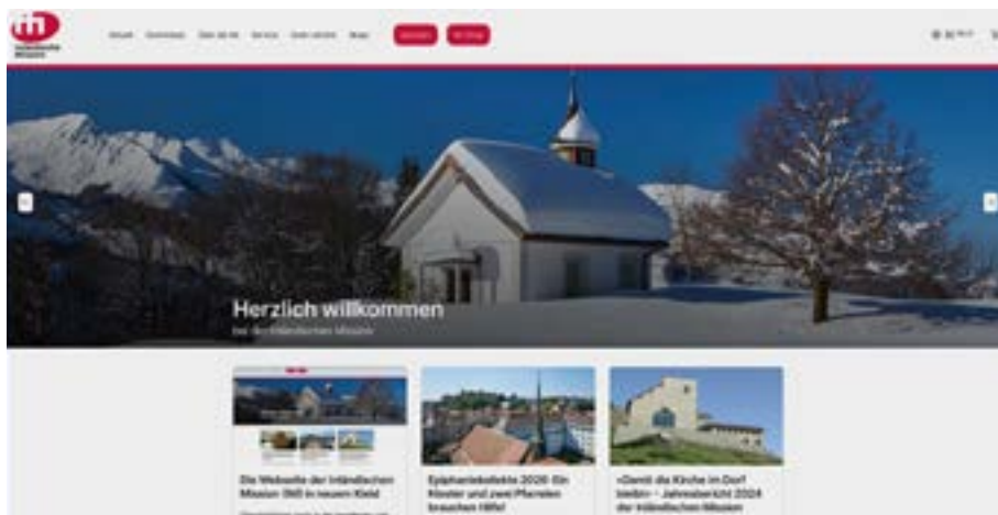
Die neu gestaltete Webseite der Inländischen Mission ermöglicht den Nutzern einen vereinfachten Zugriff auf Angebote ebenso wie auf Unterlagen für Gesuche.

Weiter können über den stark ausgebauten Serviceteil auf der Seite auch Adressänderungen bekanntgegeben werden. Ausserdem wird auch dem Nachhaltigkeitsgedanken ein breiterer Raum gegeben: Unter der Rubrik «Marktplatz» können Pfarreien oder Gemeinschaften