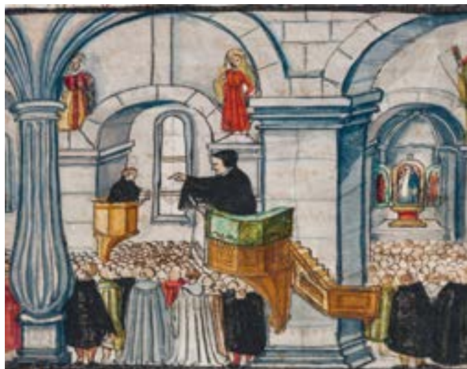
Disputation zwischen Johannes Eck und Johannes Oekolampad.

Die Badener Disputation fand im Mai und Juni 1526 in der Badener Stadtkirche statt. Teilnehmer waren Vertreter der 13 Alten Orte der Eidgenossenschaft sowie Theologen aus dem In- und Ausland. An diesem Streitgespräch wurden die Glaubensgrundlagen sowohl des alten (römisch-katholischen) als auch des neuen (reformierten) Glaubens diskutiert. Die Badener Disputation hatte eine Scharnierfunktion zwischen den Anfängen der Reformation (1523 in Zürich) und der «Lösung» in den Kappeler Kriegen (1529/1531). Der anschliessende Frieden war brüchig und oftmals bedroht, aber die Eidgenossenschaft brach nicht auseinander. Die Disput(N)ation 2026 ist ein gemeinsames ökumenisches Projekt der Reformierten Kirche Baden plus und der Römisch-katholischen Kirchgemeinde Baden-Ennetbaden. Das Gesprächs- und Friedensprojekt mit schweizweiter Ausstrahlung wird von der Inländischen Mission unterstützt, wie auch das Taizé-Treffen.