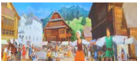
Nicolas de Flüe et Dorothee Wyss se rencontrent à l'occasion d'une danse sur la place du marché de Sarnen.