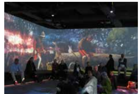
En tant que soldat, Nicolas de Flüe a été confronté à la violence. Il est ensuite devenu un saint de la paix.