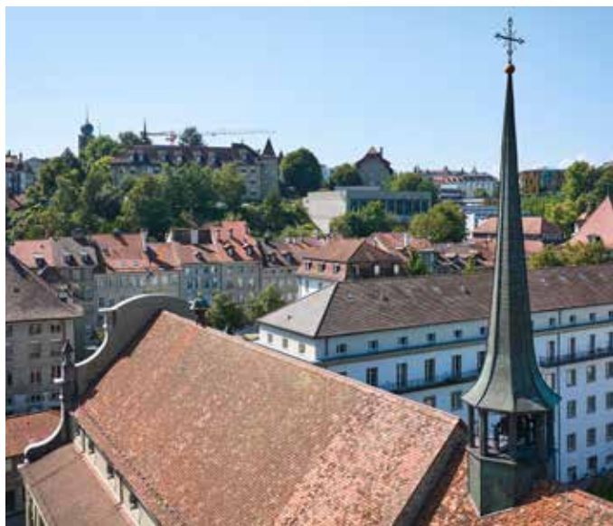
Le toit de l'église franciscaine avec le bâtiment du couvent en arrière-plan.