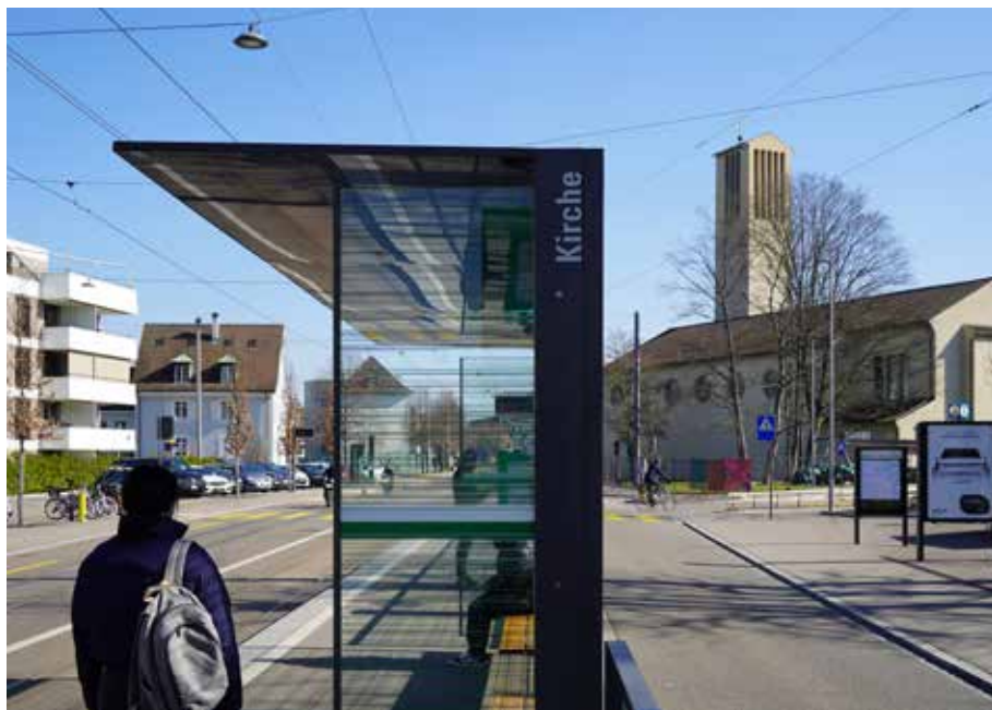
Arrêt de tram «Kirche» à Allschwil avec l'église Sainte-Thérèse.

Et cette importance des églises, qui a marqué les quartiers, doit être maintenue, même si la vie paroissiale se concentre sur un nombre plus restreint de lieux de culte. Cette position a été largement défendue lors de la Journée suisse du patrimoine religieux (Kirchenbautag). Si les centres paroissiaux peuvent sans doute être utilisés par des tiers, les espaces liturgiques posent des questions bien plus importantes. Des