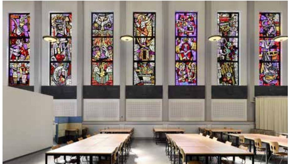
Exemple d'une reconversion précoce d'un espace religieux: après la vente en 1990 de la chapelle Regina Mundi des Marianistes, construite en 1957/1958 dans la ville de Fribourg, au canton de Fribourg, celle-ci a été ouverte à un usage profane et sert depuis 2004 de salle d'étude et de travail. Les objets liturgiques, qui sont de grande qualité, ont été recouverts de rideaux, et le maître-autel, qui n'a pas pu être déplacé en raison de son poids, a été entouré de murs en plâtre.

Sans prétendre à l'exhaustivité, la base de données recense à ce jour 228 objets (églises, chapelles et monastères) qui ont été réaffectés ou pour lesquels une réaffectation a été décidée au cours des 25 dernières années. Parmi ces objets, 93 concernent l'Église catholique romaine, 56 l'Église évangélique réformée, 74 de plus petites communautés religieuses et 5 d'autres institutions. Sur les 93 entrées catholiques romaines, 34 sont des églises et des chapelles, 8 des chapelles dans des institutions et 51 des monastères, des maisons de formation et des séminaires. Sur les 56 entrées évangéliques réformées, 54 sont des églises et 2 des maisons de