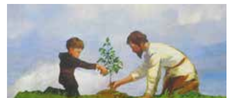
Le paysan Nicolas de Flüe plante un arbre avec l'un de ses cinq fils.