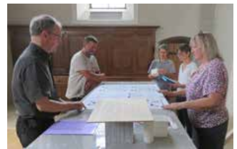
Étude de plans et discussion sur l'autel populaire.

La restauration de l'intérieur coûte, au total, un million de francs. Après déduction des contributions de la Confédération et du Canton au titre de la protection des monuments historiques ainsi que du soutien de la