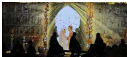
Ils se marient, fondent une famille et élèvent dix enfants. Leur descendance est nombreuse.