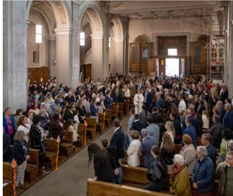
Entrée solennelle dans l'église à l'occasion d'une confirmation: (Photos: m2d)

La ville de Monthey compte plus de 19 000 habitants. Elle est le chef-lieu du district Monthey dans le Chablais, situé entre la rive sud du lac Léman et le goulet de St-Maurice. La région, qui appartenait à l'origine à l'abbaye de St-Maurice, fut reprise par la maison de Savoie au XI e siècle. En 1536, après de longues et complexes querelles entre la Savoie, Berne, Genève et le Valais, Monthey devint un bailliage valaisan. En 1602, les capucins savoyards réussirent à faire en sorte que le bailliage du Chablais redevenne catholique tandis qu'il subissait de fortes influences de la Réforme. Cependant, malgré le droit de cité, Monthey n'était pas une paroisse en soi, mais dépendait de celle de Collombey-Muraz. Sa chapelle Saint-Didier ne fut élevée au rang d'église paroissiale qu'en 1708. Un incendie et des inondations menèrent, entre 1851 et 1855, à la construction de l'église que nous connaissons aujourd'hui. De l'ancienne église, seul le clocher a été conservé. En 1855, un an après la proclamation du dogme de l'Immaculée Conception par le pape Pie IX, l'église néoclassique d'inspiration italienne fut consacrée à Notre Dame de l'Immaculée Conception.