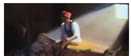
Dorothee Wyss veille sur le lit de mort de son mari Nicolas de Flüe, mort en odeur de sainteté en 1487.