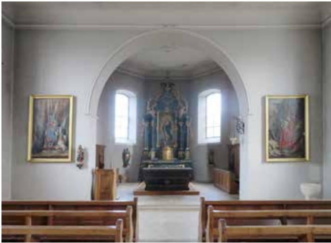
L'intérieur de l'église de Miécourt, qui exige des travaux de rénovation.