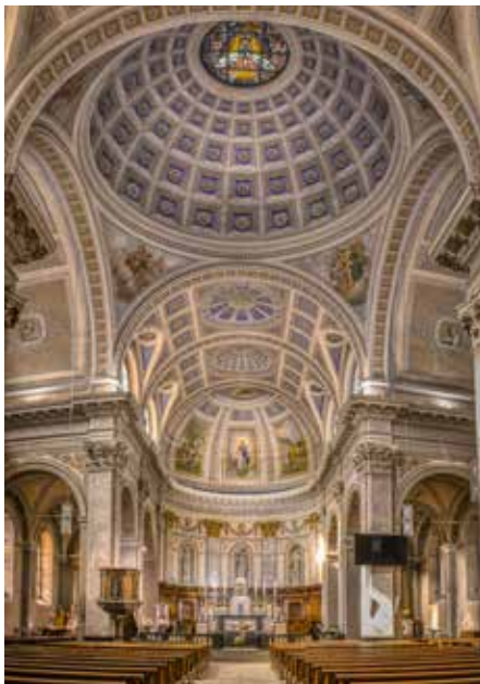
L'intérieur richement décoré de l'église.

Dès 1805, il était clair que l'église et la cure, qui n'offraient plus assez d'espace, devaient être remplacées par de nouvelles constructions. En 1806, le nouveau presbytère fut construit. Cependant, la dette liée à ce projet retarda le chantier de la nouvelle église. La première pierre ne fut posée qu'en 1851. La construction de l'église fut interrompue en 1853 en raison de difficultés financières et de problèmes de statique. Des dons anonymes permirent finalement de poursuivre les travaux et de consacrer l'église.