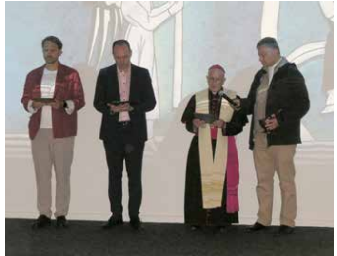
La bénédiction de Lumeum dans le cadre d'une cérémonie œcuménique.

Qu'est-ce que Lumeum? Dans l'ancienne piscine du monastère de Béthanie à St. Niklausen (OW), tout près du Ranft, un espace exceptionnel vous attend. Pendant quarante minutes, l'histoire de la vie de Nicolas de Flüe et de son épouse Dorothee Wyss est racontée à travers une centaine de peintures à l'huile projetées lors d'une expérience immersive à 360 degrés. Ce show, réalisé avec l'aide de 24 vidéo-projecteurs, plonge les visiteurs dans un tourbillon de sons et de lumières. Le fascinant Lumeum, dont le nom est dérivé du latin «lumen» (lumière), a été inauguré le 11 octobre 2025. Un projet magnifique!