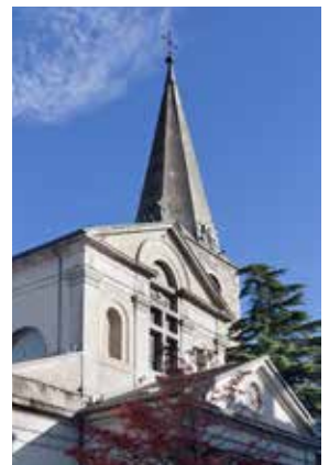
L'extérieur de l'église.

de l'extérieur et de l'intérieur, de manière à pouvoir répondre aux exigences actuelles. Toute la maçonnerie sera renouvelée, ainsi que les fenêtres, les installations électriques et le toit ainsi que tout l'intérieur. Toutes les surfaces seront nettoyées et repeintes, de même que le mobilier sera nettoyé et réparé si nécessaire. L'avenir de cet impressionnant lieu de culte pourra ainsi être assuré, de même que le maintien de son utilisation liturgique. Les travaux de rénovation commenceront en mars 2026 et devraient s'achever en décembre 2027. (ufw)