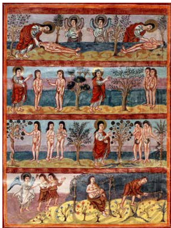
La création de l'homme et l'expulsion hors du paradis terrestre.