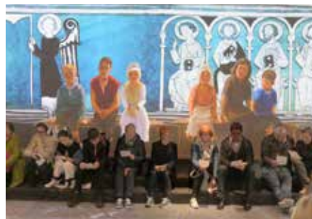
Le Lumeum a été inauguré dans le cadre d'une cérémonie œcuménique, avec des prières et des chants.