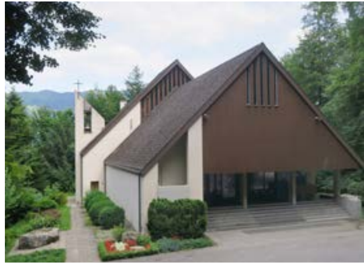
L'ormai vetusta chiesa del 1966.