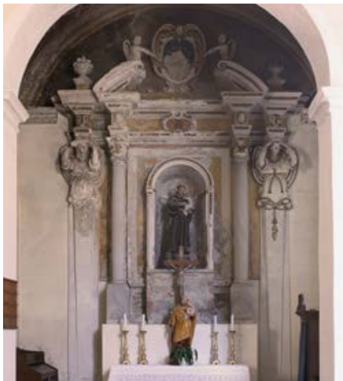
L'altare laterale gravemente danneggiato con due statue dei santi.