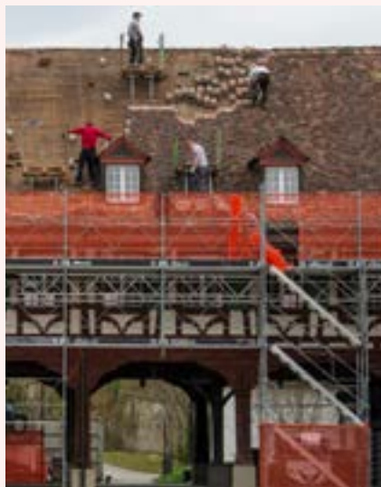
Il paesaggio dei monasteri in Svizzera è in fase di ristrutturazione. (Immagine simbolica: mad)

Per la terza volta, l'Università di Lucerna e la Missione Interna invitano a un convegno sul «Futuro dei monasteri». Al simposio del 31 gennaio 2025 a Lucerna si affronterà la questione di come le persone danno forma allo spazio monastico, ma anche se e come questo spazio dà forma alle persone una volta che la comunità monastica lo ha abbandonato. La giornata di studio prevede tre incontri principali – Vivere con il passato – Diventare capaci di agire nel presente – e Sognare il potenziale futuro – in cui saranno presentati esempi di trasformazioni monastiche di successo tramite relazioni e sessioni di riflessione. Grande importanza sarà data al dialogo tra i partecipanti. Anche se i piani per la conversione o il nuovo uso dei monasteri non possono essere trasposti letteralmente nella realtà, l'obiettivo è quello di offrire spunti di riflessione basandosi