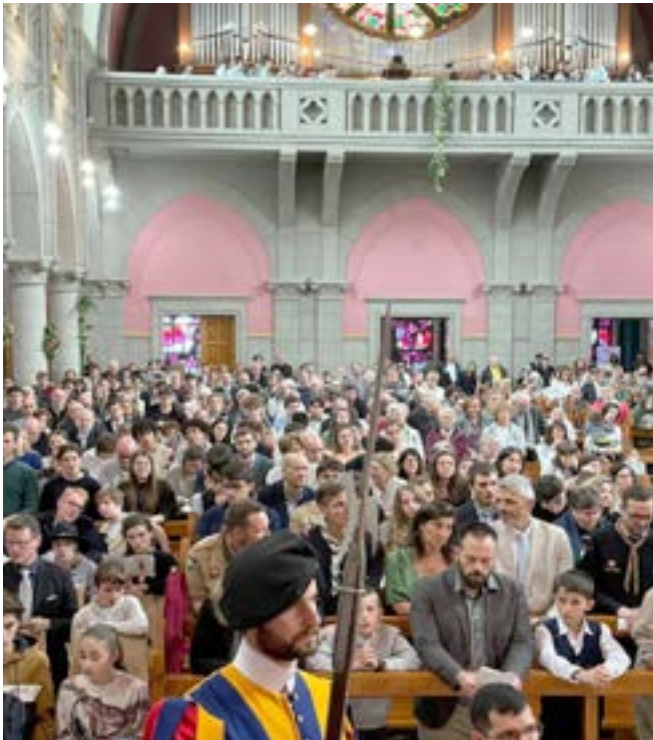
L'interno della chiesa neogotica del Sacro Cuore .