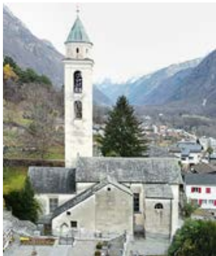
Vista sulla chiesa parrocchiale con il suo campanile.

Situata sul versante meridionale delle Alpi, la Mesolcina italoфона è parte integrante della Lega Grigia fin dalla fine del XV secolo e dal 1804 del Cantone dei Grigioni. Come il suo fiume Moesa, a sud, la Mesolcina si apre verso il Canton Ticino, mentre a est confina con l'Italia, a ovest con la Riviera e la Calanca e a nord con la Valle del Reno. Già nel Medioevo, la Mesolcina rappresentava uno dei percorsi che collegava il sud con il nord dell'Europa. Oggi l'autostrada A13 che attraversa la valle, riveste una grande importanza sull'asse nord-sud come percorso alternativo al tunnel del San Gottardo.