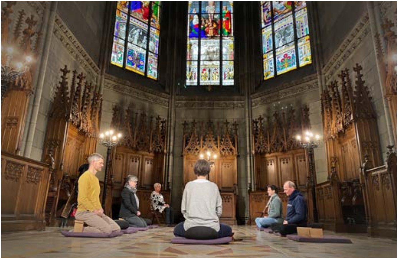
Tempi regolari di meditazione fanno parte dell'offerta delle «citychurches» – nell'immagine la «Offene Kirche Elisabethen» a Basilea.

Le chiese dei centri storici delle città attirano un grande pubblico. Accanto a queste, si aggiungono le «citychurches» ovvero quegli spazi che, presentandosi almeno in origine come offerta pastorale sperimentale su prevalente base ecumenica, dispongono di un programma religioso alternativo. Con forme e iniziative di carattere non vincolante dal punto di vista religioso, invitano le persone a confrontarsi con la fede e la spiritualità.