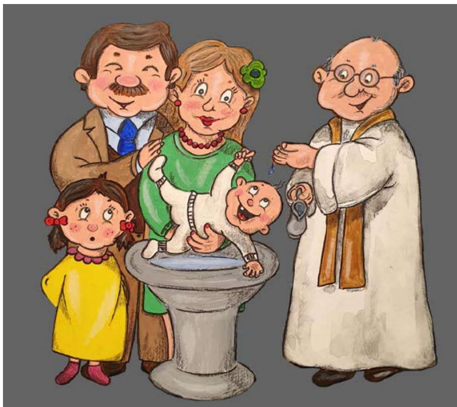
Le baptême de son frère éveille la curiosité de Hanna sur la signification des sacraments. (Illustrations : Sandy Jud)

Pour accompagner les explications sur les sacraments, leur signification, les symboles de la liturgie et leur ancrage dans la vie quotidienne, l'auteur propose de