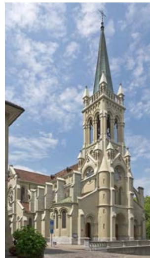
Église Saint-Pierre-et-Paul.

droit public, des communes ecclésiastiques ont été créées et des impôts ecclésiastiques ont été introduits. En 1956, Pie XII éleva l'église de la Trinité au rang de «basilica minor». Cette décision fut motivée par l'importance de Berne en tant que capitale et lieu de diplomatie, où travaille également le nonce du Pape. Berne fut ainsi traitée de la même manière que Bonn, qui était alors la capitale de la RFA. (ufw)