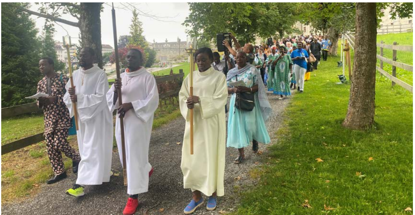
Le pèlerinage africain à Einsiedeln avec la messe et la prière du chemin de croix, est devenu une tradition chère à de nombreux fidèles.

Le festival «Metanoia» («moment de conversion» en grec) organisé cette année sur la plaine de Vérollez, près de St-Maurice, est un événement majeur qui, pour la première fois, est bilingue, après la version germanophone organisée en 2023 au monastère de Béthanie. Des représentations théâtrales, des ateliers, des concerts, des soirées de prière, des offices religieux et de nombreux autres événements ont été programmés pendant les cinq jours de la rencontre, mi-juillet 2024. Cette année encore, le festival a été dominé par la joie de vivre, le recueillement, le plaisir et la réflexion intérieure, comme on nous l'a rapporté avec enthousiasme. Le grand spectacle en plein air «La flamme des martyrs» a rappelé le don de vie de la légion