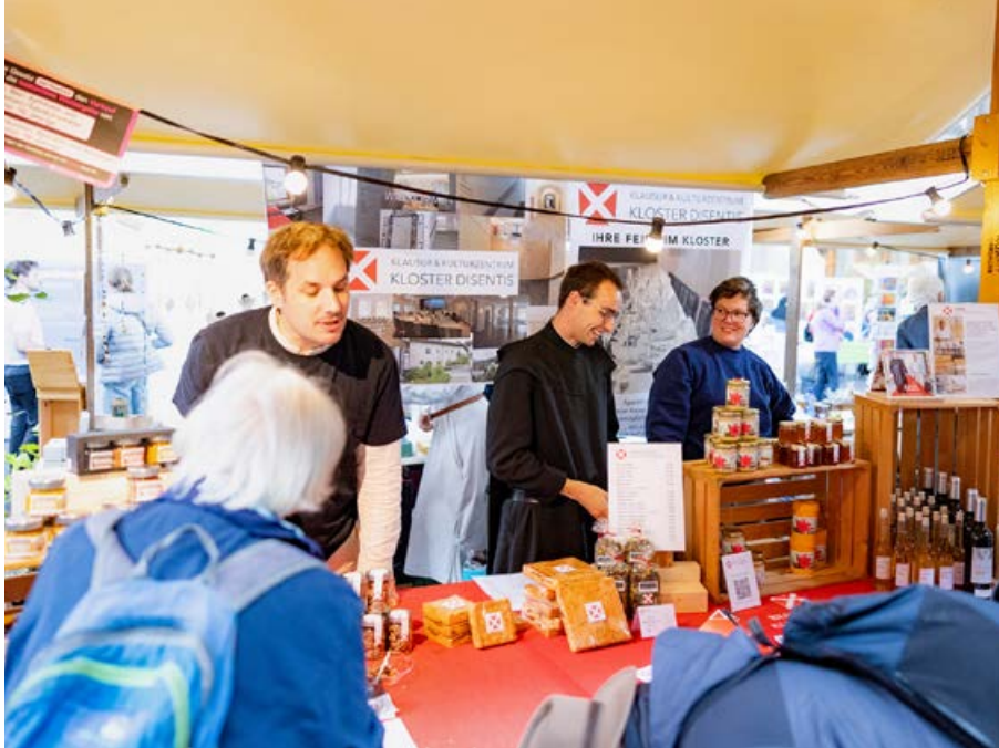
Le marché du monastère dans le grand hall de la gare centrale de Zurich a rassemblé de nombreuses personnes.

La MI soutient avec enthousiasme cette plateforme monastique. De nombreux monastères sont confrontés à de grandes difficultés, comme l'illustrent les deux congrès sur l'avenir des monastères qui ont été menés par la Mission intérieure en collaboration avec la chaire d'histoire de l'Église de l'Université de Lucerne. Une fondation ecclésiale a été créée pour le couvent des capucines sur le Gubel, au-dessus de Menzingen, dans le but de permettre aux sœurs d'y rester et d'assurer la pérennité du site. La Mission Intérieure s'est engagée avec d'autres partenaires à créer un poste temporaire de chef de projet à cet effet. Le paysage des monastères évolue à un rythme soutenu, ce qui a incité la Haute école de Lucerne à mettre en place un réseau de monastères en coopération avec le monastère de Baldeg, afin d'identifier le potentiel d'avenir des