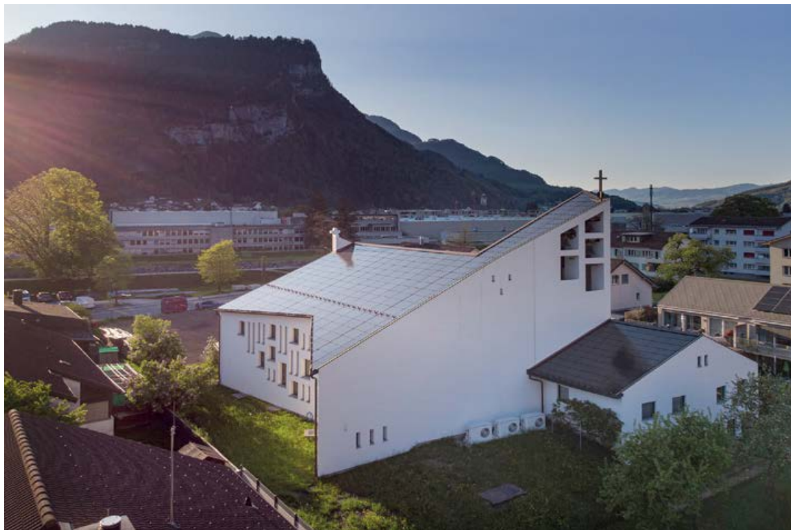
A Mollis, on s'accorde à dire que la Marienkirche grâce au toit photovoltaïque a encore gagné en beauté.

Dans la ville glaronnaise de Mollis, le toit de sa moderne église Sainte-Marie devait être remplacé. La fondation Marienkirche Mollis, propriétaire de l'église, a misé sur une solution durable en optant pour une toiture solaire. En étroite collaboration avec la protection des monuments, une grande valeur ajoutée a ainsi été obtenue. Cette mesure, conjuguée à la rénovation énergétique de l'église, a été récompensée par le Norman Foster Solar Award 2023. Le service oeku Kirchen für die Umwelt , à Berne, fournit des informations générales sur le sujet.