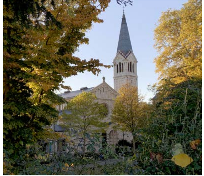
La basilique de la Trinité, église mère de la ville de Berne.

À Berne même, la vie catholique put se développer malgré des conditions financières très difficiles grâce à des curés catholiques remarquables, des religieuses et des laïcs. La paroisse catholique bénéficia de l'hospitalité de la Predigerkirche (aujourd'hui appelée «église française») jusqu'à ce que la première église catholique soit consacrée en 1864 sous le patronage des apôtres Pierre et Paul. La même année, l'ensemble du canton de Berne fut intégré à l'évêché de Bâle, alors que, auparavant, c'était l'évêque de Lausanne qui couvrait la ville de Berne et autres régions. Pendant le Kulturkampf, la majorité des hommes de confession catholique, à Berne – avec le plus grand soutien du gouvernement bernois, qui voulait une église d'État – décidèrent de devenir catholiques-chrétiens. Cela a abouti à la perte de l'église paroissiale Pierre et Paul en 1875. Pendant plusieurs années, l'office religieux catholique a été organisé dans la Predigerkirche, puis dans d'autres lieux. Le curé Jakob Stammeler, nommé à ce poste en 1876, fonda en 1883 une association culturelle qui permit l'achat du terrain sur lequel fut érigée l'église de la Trinité, inaugurée en 1899. Cet énergique curé de