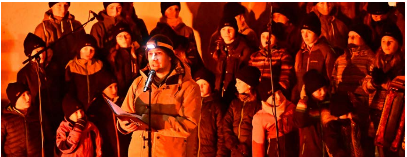
Une chorale d'enfants lors de la Rencontre du Ranft 2023, organisée chaque année par la section suisse de la Jungwacht Blauring.