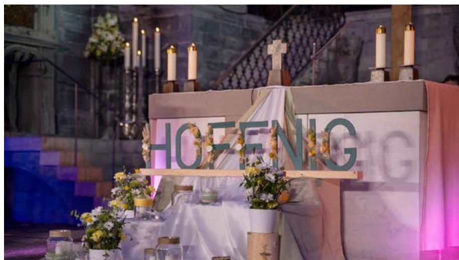
L'espérance en tant que devise de la Rencontre mondiale de la jeunesse en mai 2024 à Coire.

Avant l'année sainte 2025, le pape François a proposé deux versets bibliques aux participants des rencontres des Journées Mondiales de la Jeunesse : «Ayez la joie de l'espérance» (Rm 12,12), ainsi qu'une promesse du prophète Isaïe : «Mais ceux qui se confient en le Seigneur [...] courront et ne se fatigueront point» (cf. Is 40,31). Ces paroles ont également marqué la rencontre mondiale de la jeunesse germanophone qui s'est déroulée du 3 au 5 mai 2024 à Coire. Des concerts entraînants aux impulsions palpitantes, en passant par des ateliers variés et l'adoration, tout y était. Les membres de «Living Stones», qui proposent des visites d'églises gratuites à bas seuil, sont également soutenus.