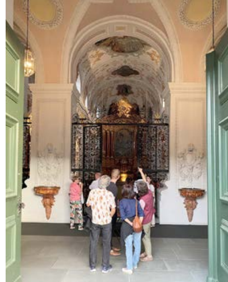
Portes ouvertes des églises à l'occasion de la Lange Nacht der Kirchen à Lucerne: des membres de «Living Stones» présentent l'église des Jésuites.

Très inégale en Suisse, la rémunération des prêtres est particulièrement problématique dans les vallées tessinoises. Dans la haute vallée de la Maggia, gravement touchée par les intempéries, seuls deux prêtres doivent