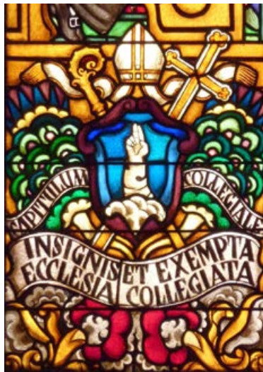
Le blason de la collégiale.