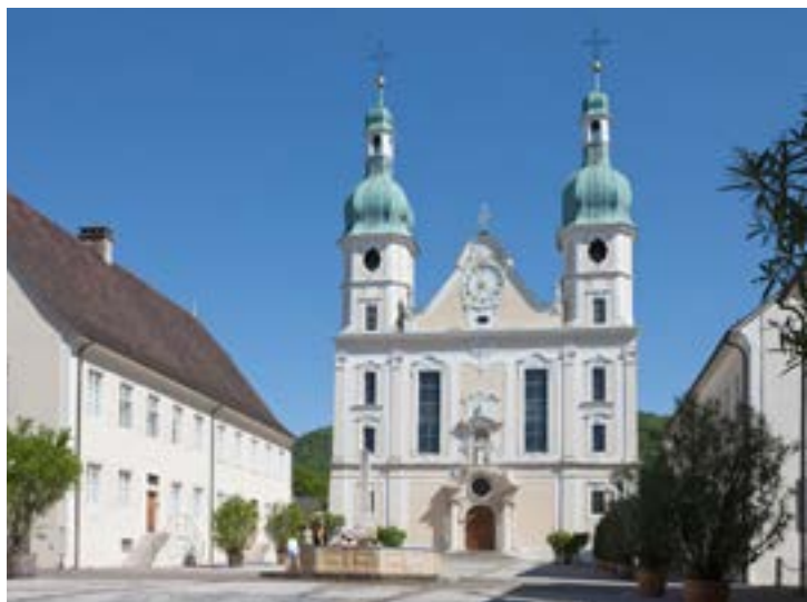
Il Duomo di Arlesheim con le case dei canonici.

Il termine geografico Birseck non è molto conosciuto. Situato nella parte bassa del corso del fiume Birs, esso comprende i cinque comuni di Arlesheim, Münchenstein, Reinach, Aesch e Pfeffingen nel Cantone di Basilea Campagna, Dornach sulla riva orientale del fiume che appartiene a quello di Soletta. Il Birseck è quindi la parte più alta della pianura dell'Alto Reno, che, partendo da Aesch, sotto Pfeffingen, si estende poi verso nord per oltre 300 km, raggiungendo la regione di Francoforte sul Meno. A differenza dell'antico Contado di Basilea, che divenne protestante dopo la Riforma di Basilea del 1529, il Birseck rimase cattolico, continuando ad appartenere fino al 1792 al Vescovado della Città renana, al cui capo stava il Vescovo-Principe ormai residente a Porrentruy. Dopo un breve periodo di transizione, dal 1793 al 1814, il Birseck divenne dominio francese fino a quando, nel 1815, il Congresso di Vienna lo accorpò al Cantone di Basilea. Dalla separazione dell'antico Cantone di Basilea nel 1833, il Birseck, ad eccezione di Dornach, appartiene al distretto di Arlesheim del Cantone di Basilea Campagna.