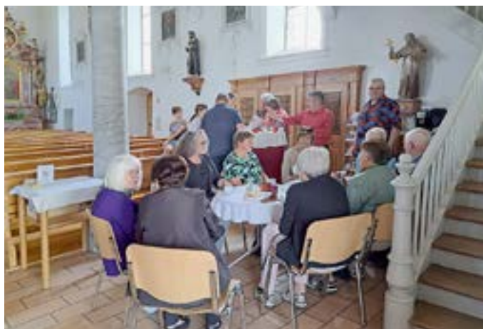
Caffè parrocchiale: nella chiesa di San Michele a Berg (SG), i parrocchiani si incontrano per un caffè dopo la celebrazione.