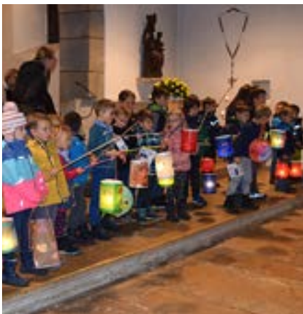
Bambini in chiesa dopo le celebrazioni patronali.

I costi per la ristrutturazione complessiva ammontano a CHF 3,46 mio. La piccola comunità parrocchiale di soli 673 fedeli si sente schiacciata dal tale peso finanziario per un'opera irrinunciabile. Per tale ragione è necessario sostenersi a un aiuto esterno. Grazie mille per ogni donazione!