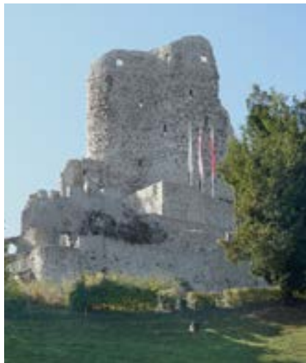
Le rovine della fortezza di Pfeffingen.

Pfeffingen è uno dei villaggi più antichi del Birseck. Le sue origini risalgono all'epoca romana. Intorno alla metà del V secolo, gli Alemanni che avevano attraversato il Reno colonizzarono queste pendici del Giura. Dopo la sottomissione degli Alemanni da parte dei Franchi, la zona fu cristianizzata. Lo testimonia la dedizione a San Martino di Tours della chiesa di Pfeffingen. Non è certo a quando risalga il primo edificio sacro dedicato al Santo, ma probabilmente al VII o all'VIII secolo. Aesch (fino al 1803), Duggingen e Grellingen (fino al 1841/1842), Himmelried, Nenzlingen e