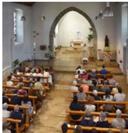
Celebrazione eucaristica in una chiesa da ristrutturare