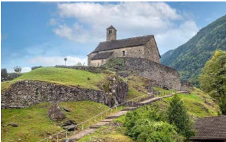
La chiesa di Santa Maria a Giornico può essere aperta con un'app sul cellulare.