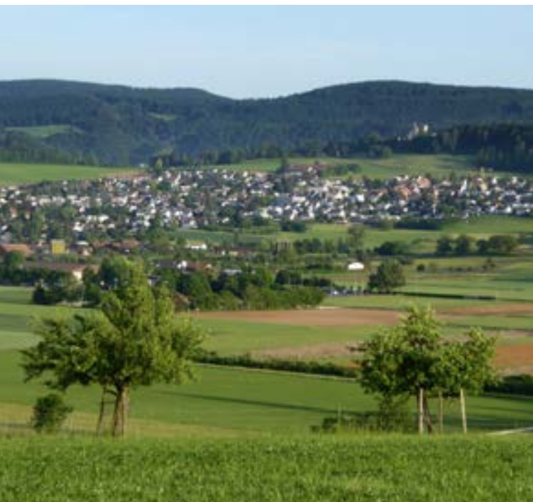
Pfeffingen con le rovine del suo castello sullo sfondo.