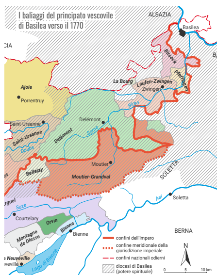
Il Vescovado di Basilea verso il 1770. (Mappa: DSS 1998)

Nel 1815, il Congresso di Vienna annesse il Birseck cattolico al Cantone riformato di Basilea, a condizione che le locali comunità cattoliche potessero continuare ad amministrare in modo autonomo tutto il patrimonio di natura religiosa, educativa ed assistenziale. Nel 1833, quando dalla separazione da Basilea Città nacque il Cantone di Basilea, quattro quinti della sua popolazione era di confessione protestante. Il Kulturkampf dopo la proclamazione del Dogma dell'Infallibilità pontificia del 1870 portò nel 1871 all'imposizione della Legge sulla nomina dei parroci e nel 1873 alla cacciata del Vescovo Lachat, ma investì il Birseck in modo meno radicale che il vicino Laufental e finì per rafforzare i cattolici locali fedeli al Papa che scelsero di organizzarsi in associazioni libere. Nel 1994, l'exclave bernese di Laufental di ininterrotta tradizione cattolica è entrata a far parte del Cantone di Basilea Campagna come suo sesto distretto. Dopo il 1950, la popolazione dei comuni del Birseck è fortemente aumentata e, come tutto la regione situata a sud della città di Basilea anche questo territorio è densamente urbanizzato e secolarizzato. (ufw)