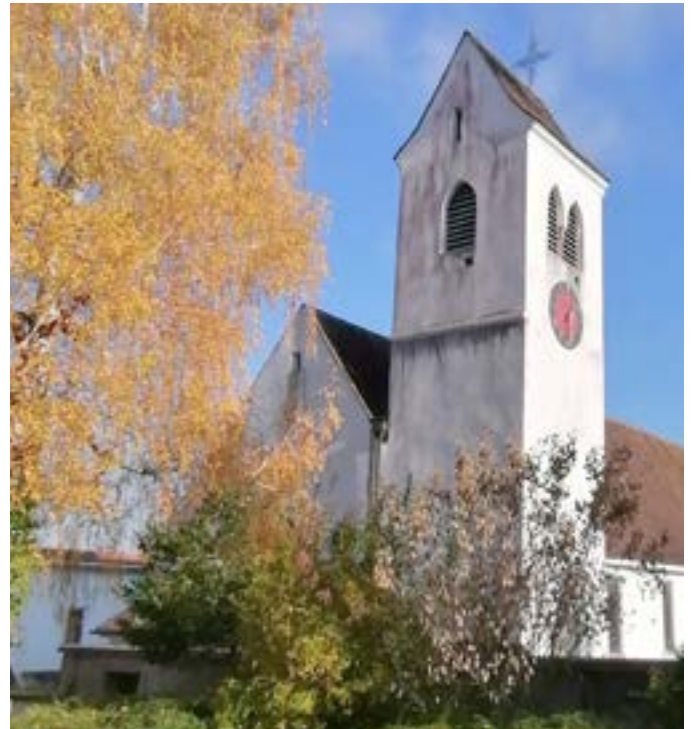
Vista esterna sulla chiesa parrocchiale di Pefffingen di San Martino.

Menzionata per la prima volta nel 1322, la chiesa dedicata a San Martino fu eretta sulle fondamenta di edifici sacri risalenti al VII/VIII secolo e al XII secolo. Il tempio attuale fu iniziato prima del 1343 e rimaneggiato nel XVII secolo, per poi essere completamente restaurato negli anni 1949–1955. Gli scavi effettuati durante quest'ultima ristrutturazione, quasi 70 anni fa, dimostrano che la chiesa carolingia primitiva misurava circa 6 metri per 6. Nella seconda metà dell'XI secolo fu costruita una chiesa romanica. Solo poco dopo fu costruita una terza chiesa, mentre nella prima metà del XIV secolo per la costruzione dell'edificio gotico che vediamo ancora oggi fu demolita la chiesa romanica precedente. Nel 1322 il conte Rudolf von Thierstein donò l'altare mariano. La stessa famiglia utilizzò il coro della nuova chiesa come luogo di sepoltura dei suoi membri defunti. Dopo un periodo di costruzione insolitamente lungo, questa chiesa gotica fu consacrata nel 1343. Durante il restauro degli anni '50 sono stati scoperti dipinti del XIV secolo. A quasi 70 anni dall'ultimo restauro, la chiesa ha bisogno di essere nuovamente restaurata.