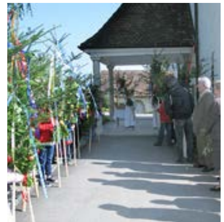
La processione della Domenica delle Palme.