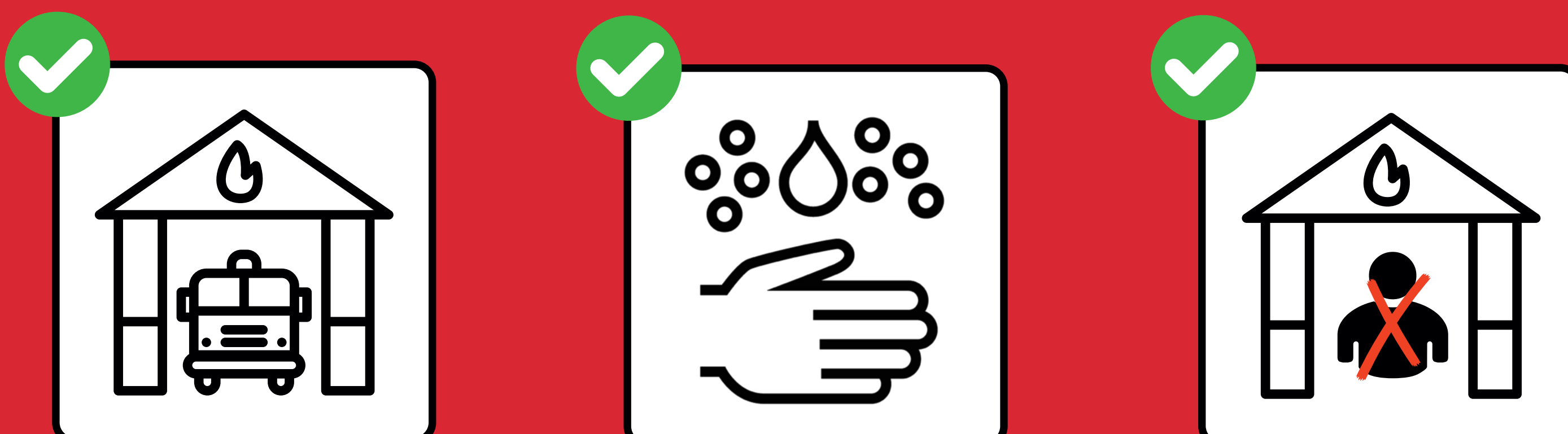
Keine Präsenz ohne klaren Auftrag.