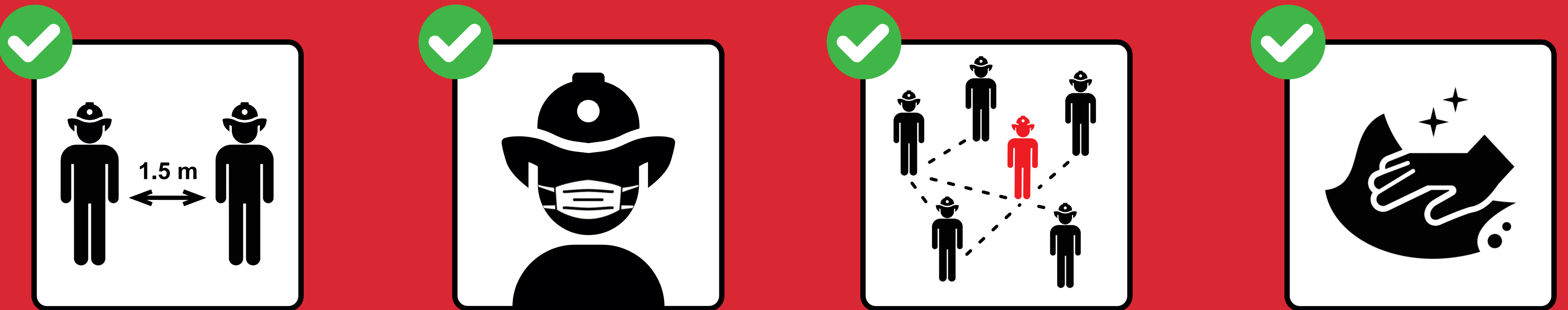
1.5 m Abstand halten