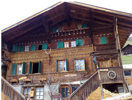
Un beau chalet à Rougemont

Succès oblige, la section Vaud est retournée, pour la quatrième fois, à Château-d'Oex en juin de cette année, avec 50 personnes à chaque voyage, afin de visiter le très intéressant Musée du Vieux Pays-d'Enhaut.