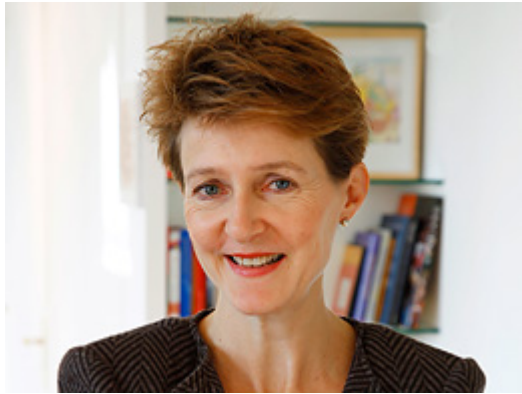
La conseillère fédérale Simonetta Sommaruga

Pour la quatrième fois, la Direction Politique économique de la FCM organisera cette année, en collaboration avec l'Europa Institut de l'Université de Zurich, une journée dite des consommateurs qui sera placée sous le thème «Les coopératives, un modèle à succès?»