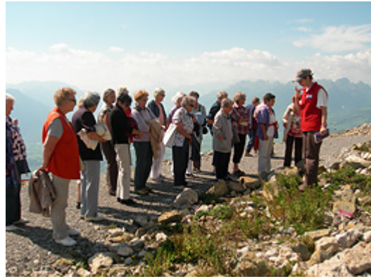
Visite du jardin alpin sur le Hoher Kasten

Lorsque le but du voyage est le restaurant tournant Hoher Kasten en Appenzell, nul doute que le beau temps doit être de la partie. De là, en effet, le promeneur jouit d'une vue somptueuse sur les environs. Or, le 19 août, les membres de la section ont eu droit à des conditions météo parfaites lorsqu'elles ont rejoint cet établissement pour un solide brunch et une intéressante excursion guidée dans le jardin alpin. Sur la route conduisant à l'étape suivante, la visite de l'entreprise de production d'eau minérale Mineralquelle AG Gontenbad, les participantes ont pu admirer des paysages alpins de carte postale. Arrivés à destination, les membres de la section ont reçu des informations détaillées sur la production des boissons à base de plantes Flauder. Mais la journée n'était pas terminée. Au programme de la fin d'après-midi figuraient encore shopping et promenade dans les rues de la pittoresque cité d'Appenzell. La sortie a été rééditée quatre fois.