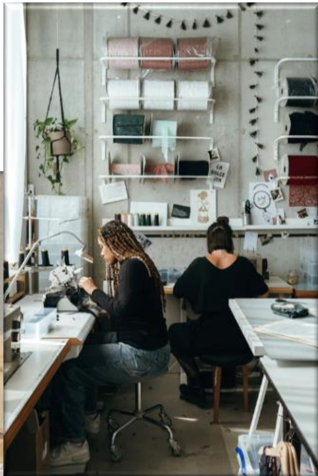
Das Atelier am Ziegeleiweg 1 in Kriens/Horw