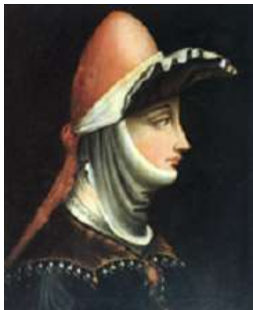
Figura femminile di grande importanza nella storia del Medioevo europeo, Matilde di Canossa a soli sei anni si ritrova erede di un territorio che andava dagli odierni Lazio fino al Lago di Garda, strategico perché punto di passaggio obbligato sia per i Pontefici che dovevano insediarsi a Roma, sia per gli imperatori che a Roma dovevano essere incoronati.

Seconda cugina dell'imperatore Enrico IV, ma fedele seguace della Riforma della Chiesa portata avanti da Papa Gregorio VII, si ritrova al centro di uno scontro epocale per la lotta delle investiture tra Papato e Impero.