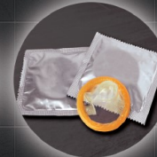
Kondome und vieles mehr ...