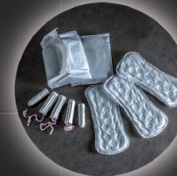
Tampons und Binden