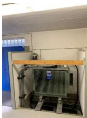
Umbau und Verstärkung TS Moos