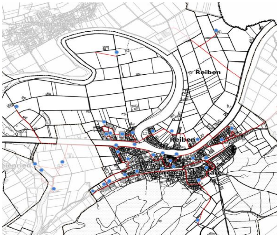
Bild: Anhand der blauen Punkte wird ersichtlich wie zum Teil die Trafostationen verstreut sind und es verschiedene Systeme für Smart-Meter zum Einsatz kommen werden.

Es wurden verschiedene Systeme als Varianten geprüft und miteinander verglichen, um Zählermessdaten auf eine Datenverarbeitungsplattform zu führen. Jedes dieser verfügbaren Systeme ergibt Vor- und Nachteile, einerseits technisch von der Datenübertragung, die vorhandene Netztopologie, Freileitungen oder Kabelleitungen, Distanzen und nicht zuletzt auch der Vergleich der Kosten. Dabei wurden Initialkosten mit den Wiederkehrenden Kosten gegenübergestellt. Die heute möglichen Datenübertragungssysteme sind: Power Line Communication (PLC) über die elektrischen Netzleitungen, Gateways mit verschiedenen Datenschnittstellen, ein End to End System über Datenleitungen wie Glasfasern Fibre to the Home (FTTH) oder als Mobilfunknetz und als weitere Variante ein eigenständiges lokales Funknetz (RF-Mesh). Unsere Erkenntnis aus dem Projekt Smart Meter Roll-Out ist Testversuche aufzubauen, um weiter Fachwissen und Erfahrung zu gewinnen.